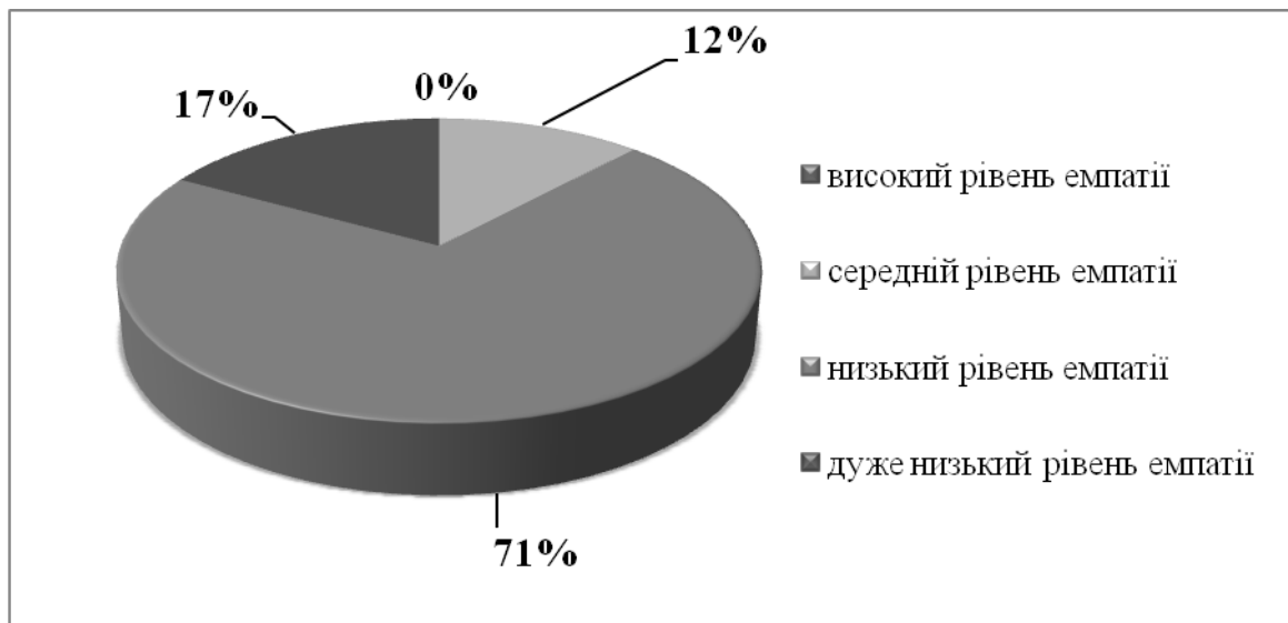
Рис. 2. Показники рівня емпатії в обстежуваній вибірці

Результати дослідження емпатійних здатностей засвідчили, що переважна більшість респондентів мають низький (71% студентів) та дуже низький (17% студентів) емпатії. Середній рівень емпатії притаманний лише 12% студентів (див. рис.2).