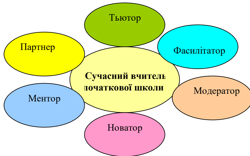
Рисунок 1.2. – Нові ролі сучасного вчителя.

Фасилітатор (від англ. facilitate): 1. сприяти, 2. допомагати, 3. полегшувати. Це вчитель, основне завдання якого полягає в стимулюванні процесу самостійного пошуку інформації та спільної діяльності учнів. Фасилітація – це організація й управління процесом обговорення певних питань (тем) у групі людей. Мета учителя-фасилітатора – організувати спілкування всіх учасників обговорення з нейтральної сторони, налагодити ефективний обмін думками таким чином, щоб зіткнення думок перейшли в конструктивне русло, розбіжності були успішно подолані і прийнятне рішення було вироблено. Роль фасилітатора – допомогти кожному думати найкращим чином.