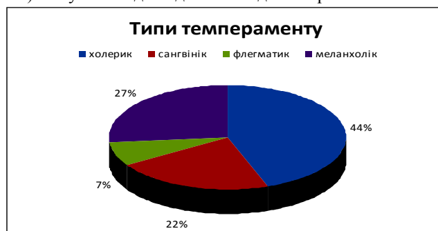
Рис. 1. Кількісні показники щодо розподілу типів темпераменту.

Наступним етапом дослідження було встановлення типу темпераменту за опитувальником Г. Айзенка із врахуванням показника щирості респондентів щодо поставлених запитань. Так, в експериментальній групі студентів виявили наступні типи темпераменту: холеричний (44,0 %), меланхолічний (27,0), сангвіністичний (22,0 %), флегматичний (7,0 %). Результати дослідження подані на рис. 1.