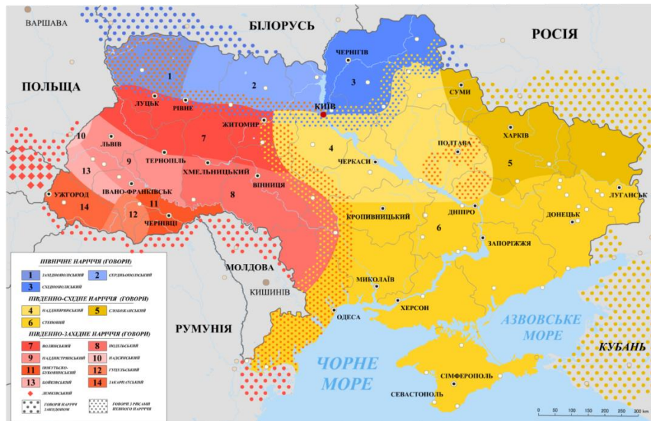
Рис. 2.16. Поширення діалектів на території України

Північне наріччя (поліське наріччя) - одне з трьох наріч української діалектної мови, що поширене в населення північної частини України.