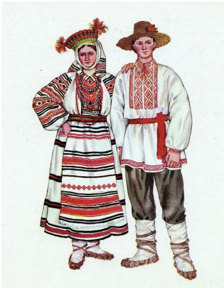
Рис.3.5. Традиційний одяг поліщуків

Поліщуки виділяються своєю народною культурою, давньою обрядовістю, звичаями, традиціями, одягом (рис. 3.5.), особливостями пісенного фольклору. Багато із них добре збереглися до сьогодення. «Тутейшні» - це назва окремих груп населення Українського Полісся з нечітко визначеною етнічною самосвідомістю. Так, десятки тисяч «тутейших» при польських переписах (1921, 1931 рр.) потрапили лише у підсумкову графу «інших» і не були зараховані до українського чи білоруського етносів. [5,17]