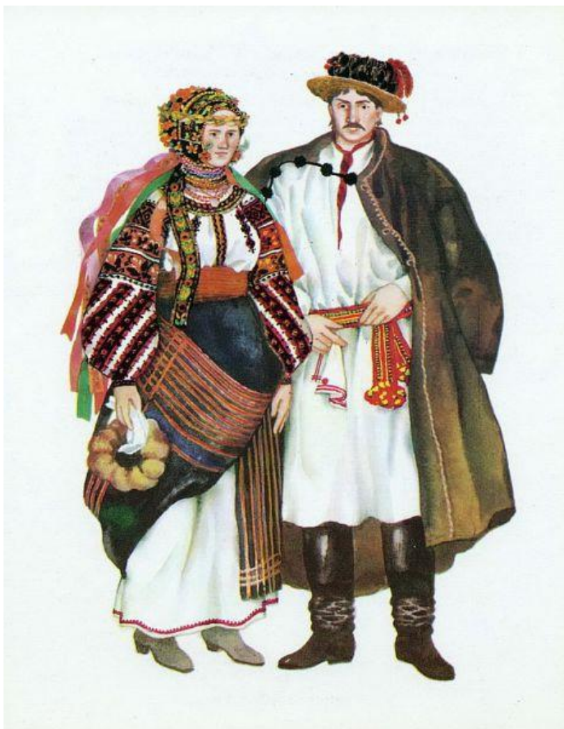
Рис. 3.1. Традиційний одяг подолян

Сьогодні схожий побут, говір, традиції та одяг мають жителі Буковини. З 1793 р. більша частина Поділля потрапила під владу Російської імперії, що спричинило заборону мови, традицій, традиційного одягу (рис. 3.1).