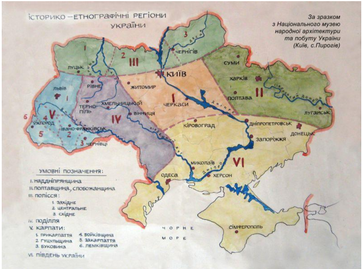
Рис. 2.2. Історико-етнографічні регіони України (Національний музей народної архітектури та побуту України (Київ, с.Пирогів)).

У Національному музеї народної архітектури та побуту України розроблено карту історико -етнографічних регіонів України враховуючи особливості побуту кожного регіону (рис. 2.2.).