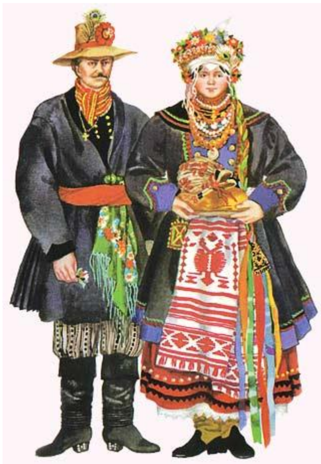
Рис.3.6. Весільний одяг слобожан