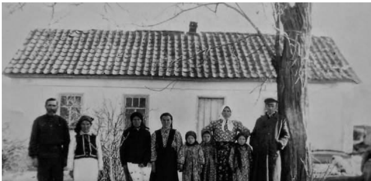
Рис.2.9. Жителі Волині

Жителі Волині будували характерні Для Полісся оселі (рис.2.9)