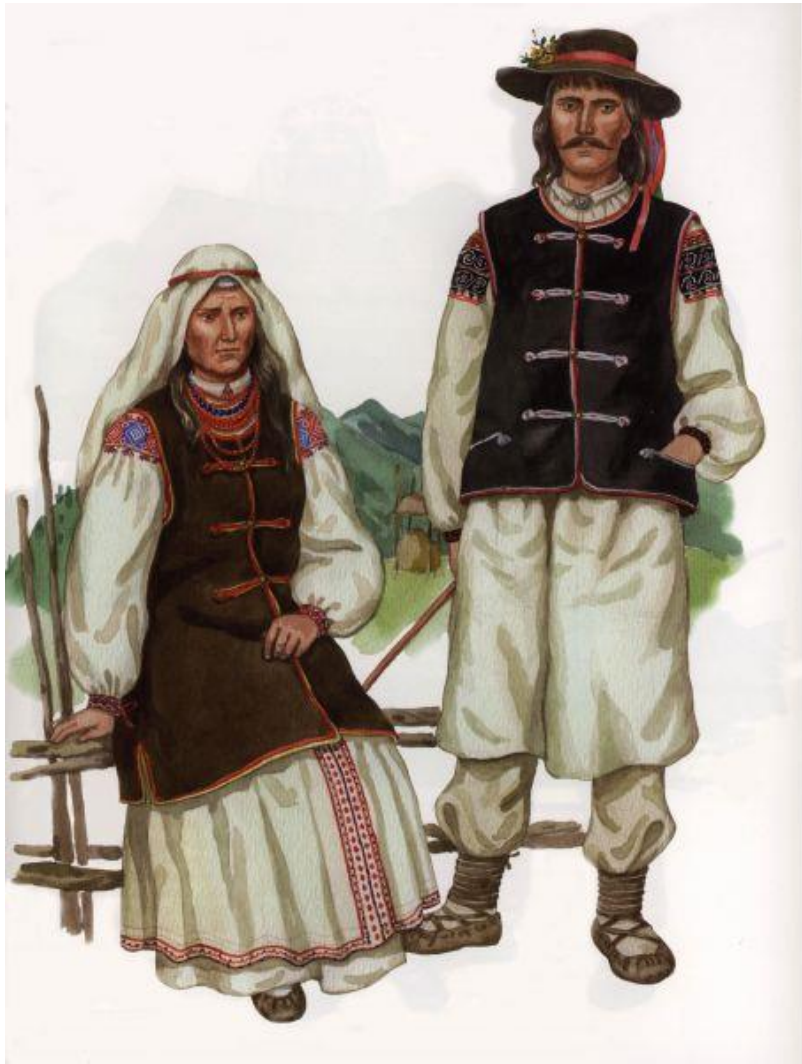
Рис.3.2. Традиційний одяг бойків

В середині XIX століття в межах Бойківщини проживало до 170-175 тисяч людей. Більша частина проживала в галицькій частині, а значно менша в Закарпатській. В XX ст. чисельність бойків досягала до до 400 тисяч людей. Найвідомішими населеними пунктами на території Бойківщини є Дрогобич, Калуш, Борислав, Болехів, Долина, Самбір, Старий Самбір, Сколе, Нижні Ворота, Турка, Воловець, Бориня, Великий Березний.