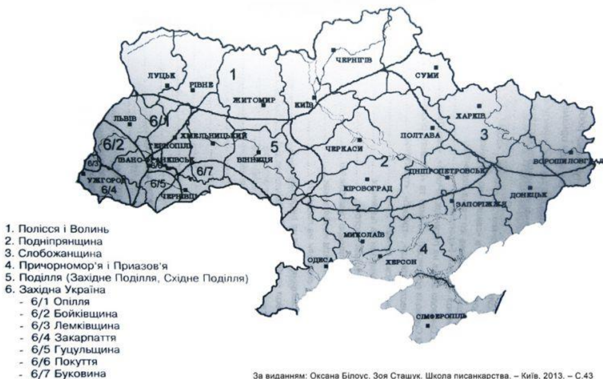
Рис 2.7. Історико-етнографічні райони України (О. Білоус, З. Сташук «Школа писанкарства»; київське видання 2013 року).

Кожному етнічному регіону відповідають сучасні адміністративні області, що представлено в таблиці 2.1