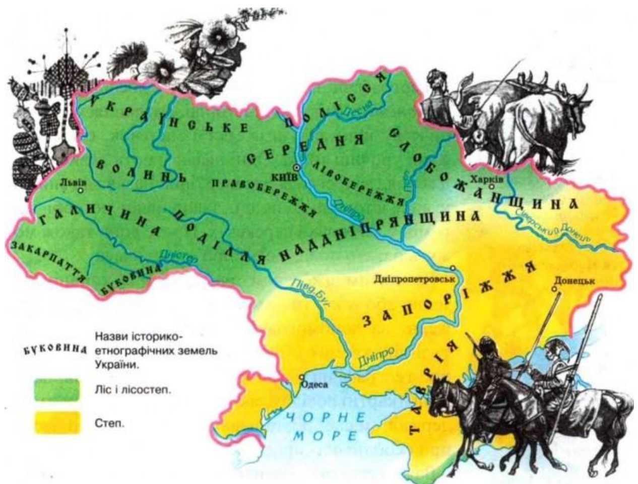
Рис 2.1. Етнографічні регіони України

Кожен вчений має свою позицією, ті ж самі регіони називаються по-різному, виділяються їхні межі в залежності від особливостей будівництва, традиційного вбрання, предметів побуту і господарського знаряддя, особливостей ведення господарства, мовних діалектів, географії, політики (рис.2.1.).