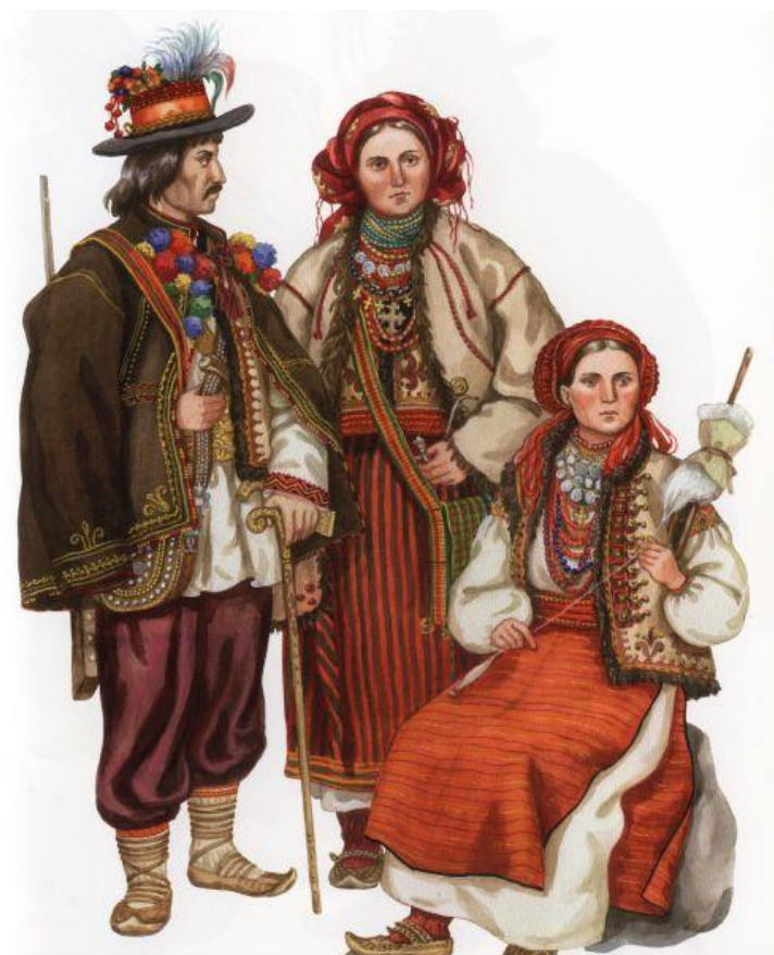
Рис. 3.3. Традиційний одяг гуцулів

Враховуючи природні умови території гуцули займалися скотарством. Землеробство велося на примітивному рівні (вирощування картоплі, кукурудзи, ячменю, льону, вівса, жита). Також займалися домашніми промислами - ткацтвом, обробкою металу і шкіри, різьбою по дереву, художньою вишивкою (рис 3.3.).