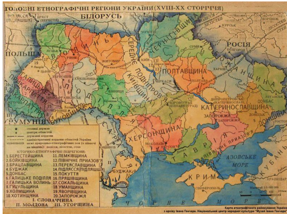
Рис.2.4. Етнографічні регіони України.

Узагальнивши карти етнографічних районів та проаналізувавши особливості побуту етнографічних груп у 2004 році було складено карту «Українські етнічні та етнографічні землі» (рис. 2.5.).