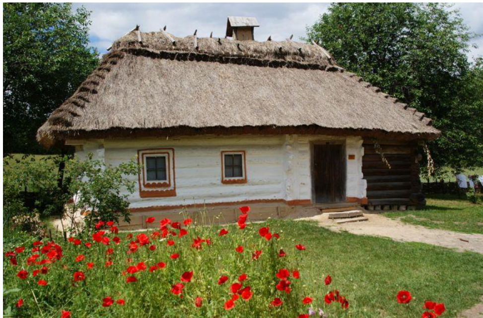
Рис. 2.11. Оселя на території Середньої Наддніпрянщини

Характерні особливості будівництва оселі показано на рис. 2.11.