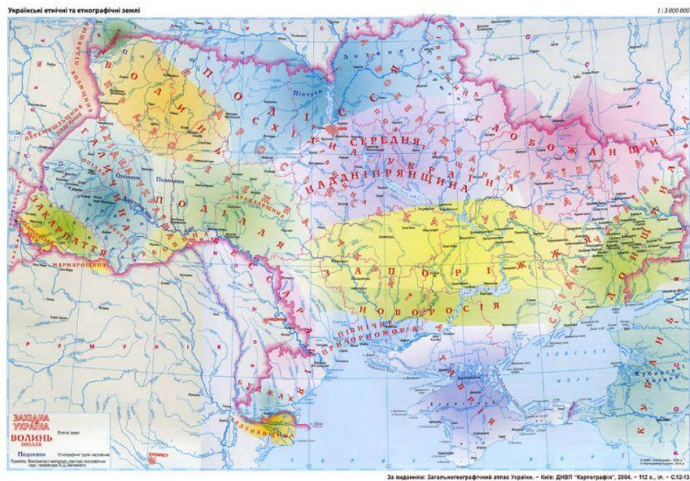
Рис. 2.5. Українські етнічні та етнографічні землі (Загальногеографічний атлас України; київське видання («Картографія») 2004 року).

Узагальнивши карти етнографічних районів та проаналізувавши особливості побуту етнографічних груп у 2004 році було складено карту «Українські етнічні та етнографічні землі» (рис. 2.5.).