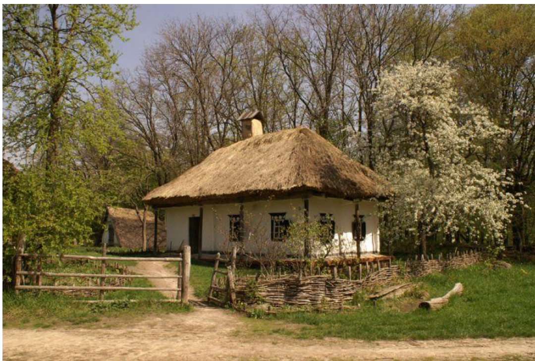
Рис.2.12. Оселя на території Слобожанщини

Характерні особливості будівництва оселі показано на рис. 2.12.