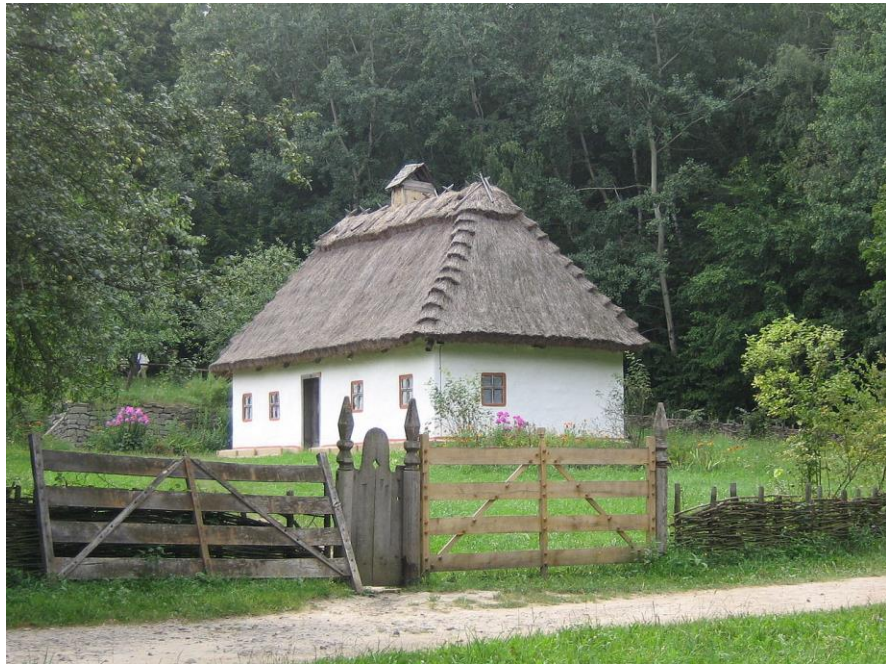
Рис. 2.10. Будинок із села Крищенці