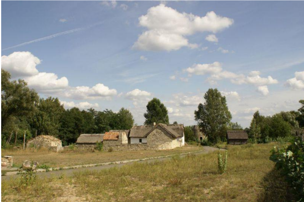
Рис. 2.15. Поселення на території Півдня

Характерні особливості будівництва оселі показано на рис. 2.15.