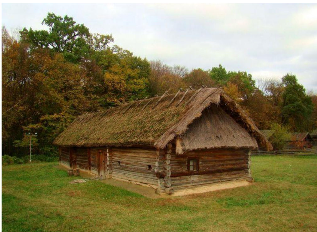
Рис.2.8. Оселя на території Полісся

Особливості побудови оселі показано на рис.2.8.