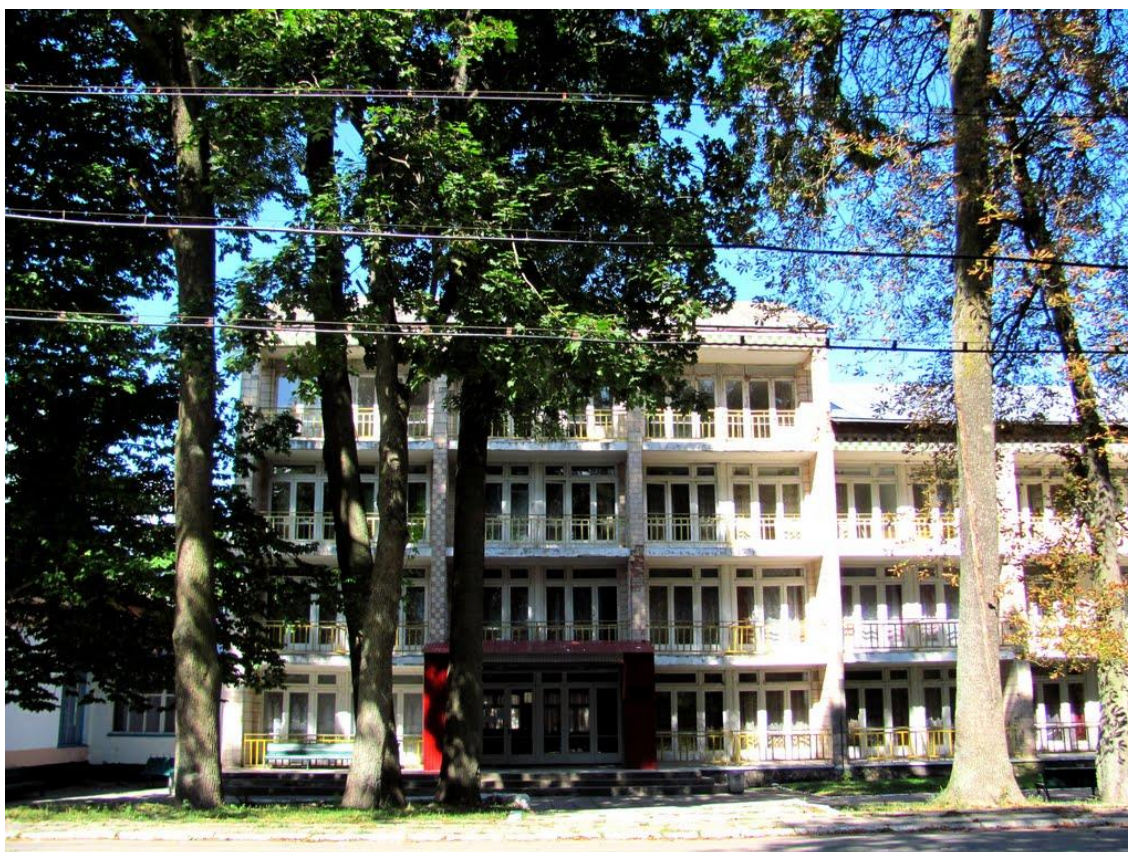
Санаторій «Горинь» [50]