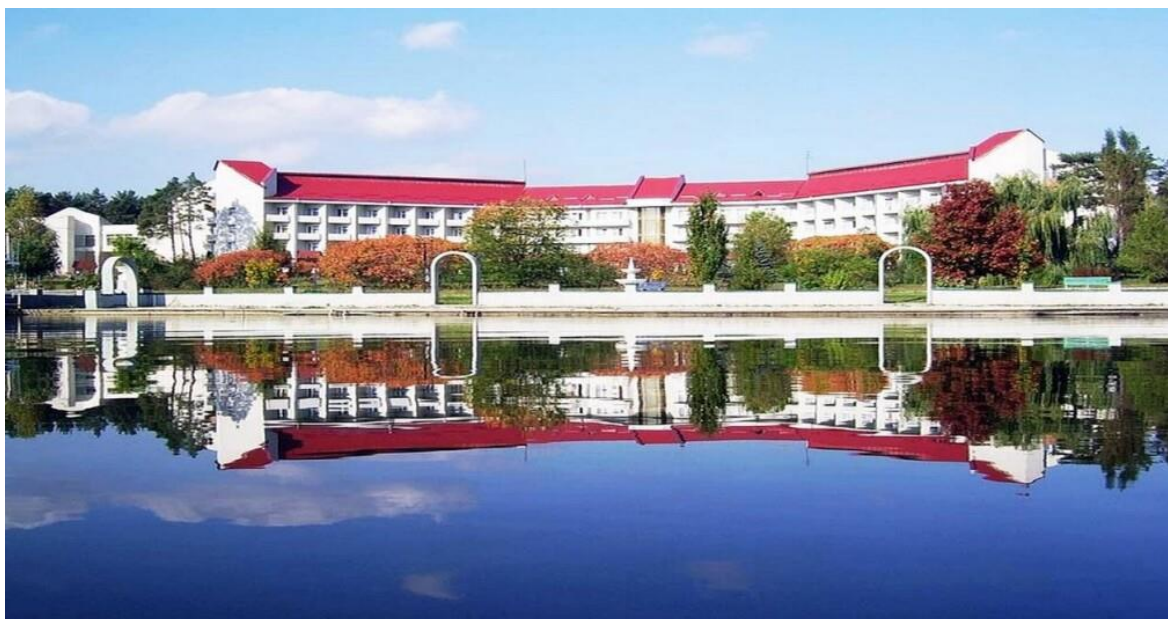
Санаторій «Червона калина» [51]