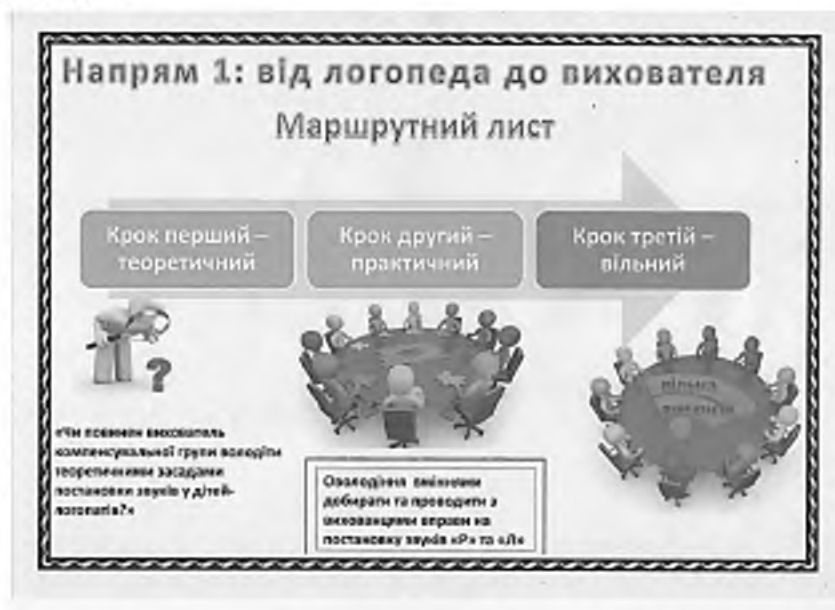
Рис. 3. Приклад маршрутного листа до педагогічного квесту