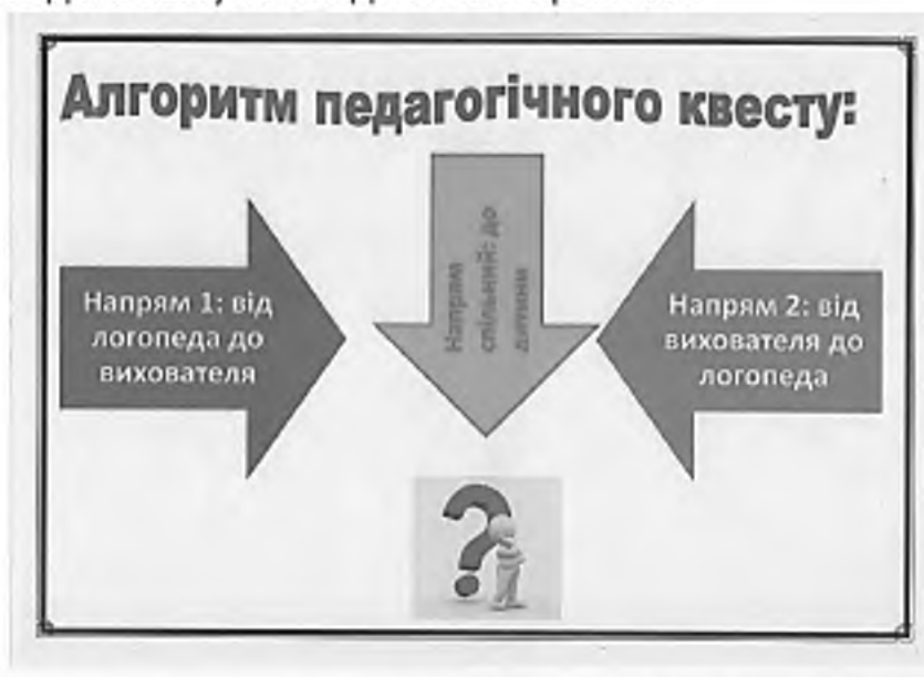
Рис. 2. Алгоритм педагогічного квесту «Співпраця вихователя компенсувальної групи та логопеда в роботі з постановки звуків дітей із вадами мовлення»

потрібна вихователю компенсувальної групи підтримка логопеда в організації навчальної діяльності вихованців?». Далі практично виявити вміння поєднувати логопедичну роботу з реалізацією завдань навчання й виховання дітей за основними освітніми лініями Базового компонента дошкільної освіти. Відбувається також ознайомлення з нетрадиційними прийомами логопедичної роботи у щоденному житті. У останній частині гри рецензенти та експерти здійснюють оцінку знахідок педагогічного квесту з позиції особистісно орієнтованого навчання і виховання. Можливе також планування спільної роботи вихователів компенсувальних груп та логопедів для виконання завдань наступної педагогічної практики.