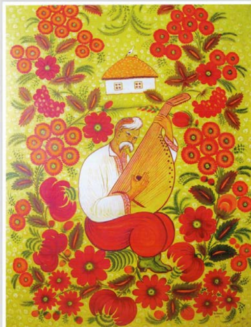
КОЗАЦЬКІ ПІСНІ ДНІПРОПЕТРОВЩИНИ

Автор малюнку: Наталія Федор Савченко. 1921 рік, нарис із збірки «Методика при застосуванні мистецтва». 1982 р.