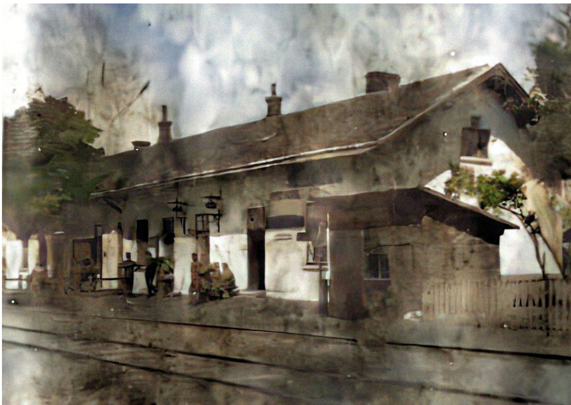
Фото 2.2. Залізнична станція Кристинопіль. 1917рр.