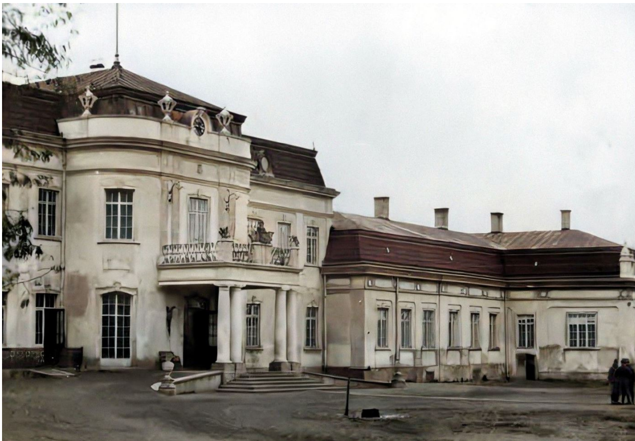
Фото 2.3. Кристинопільський палац. 1914-1918 рр.