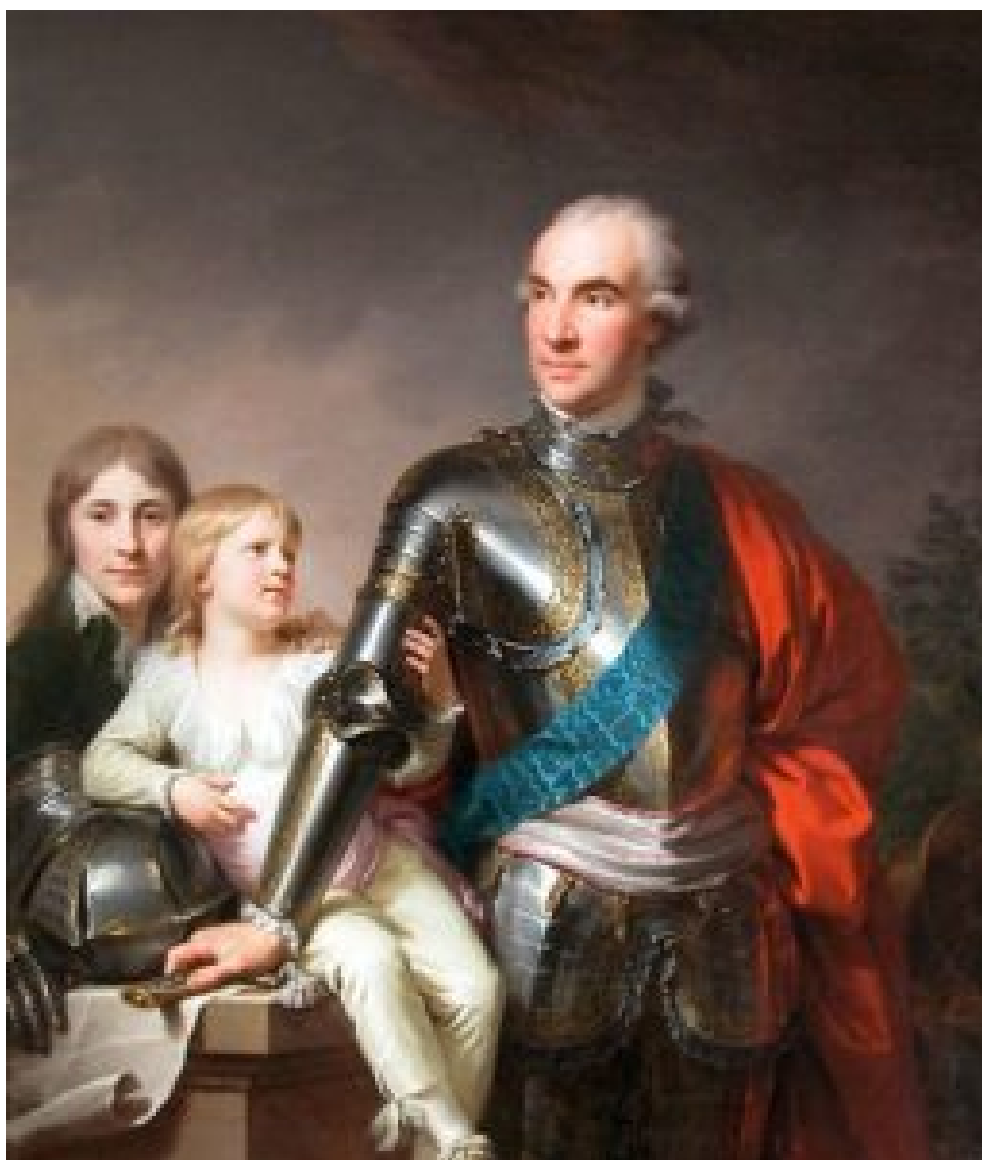
Станіслав Щесний Потоцький з синами. Художник Йоганн Баптист Лампі старший. 1790 р. Лувр. Фото 1.3. Картина походить з давньої Тульчинської колекції.