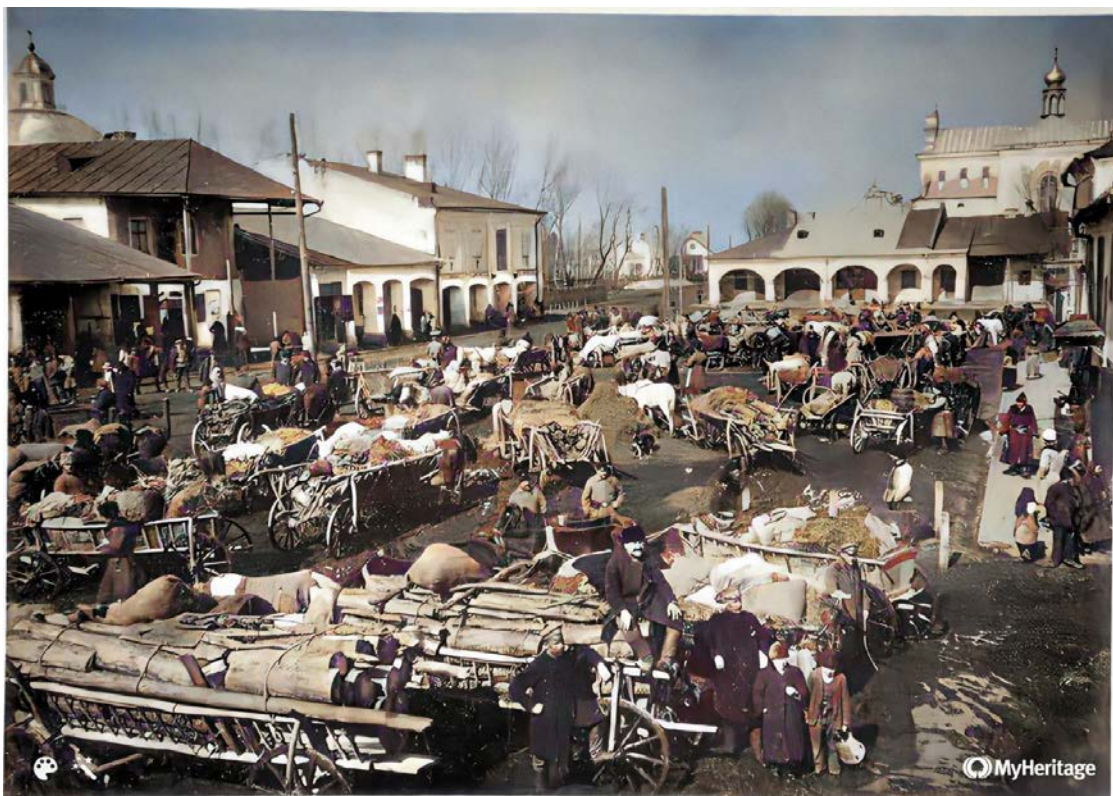
Фото 2.1.Кристинопіль: площа-ринок, 1915р.