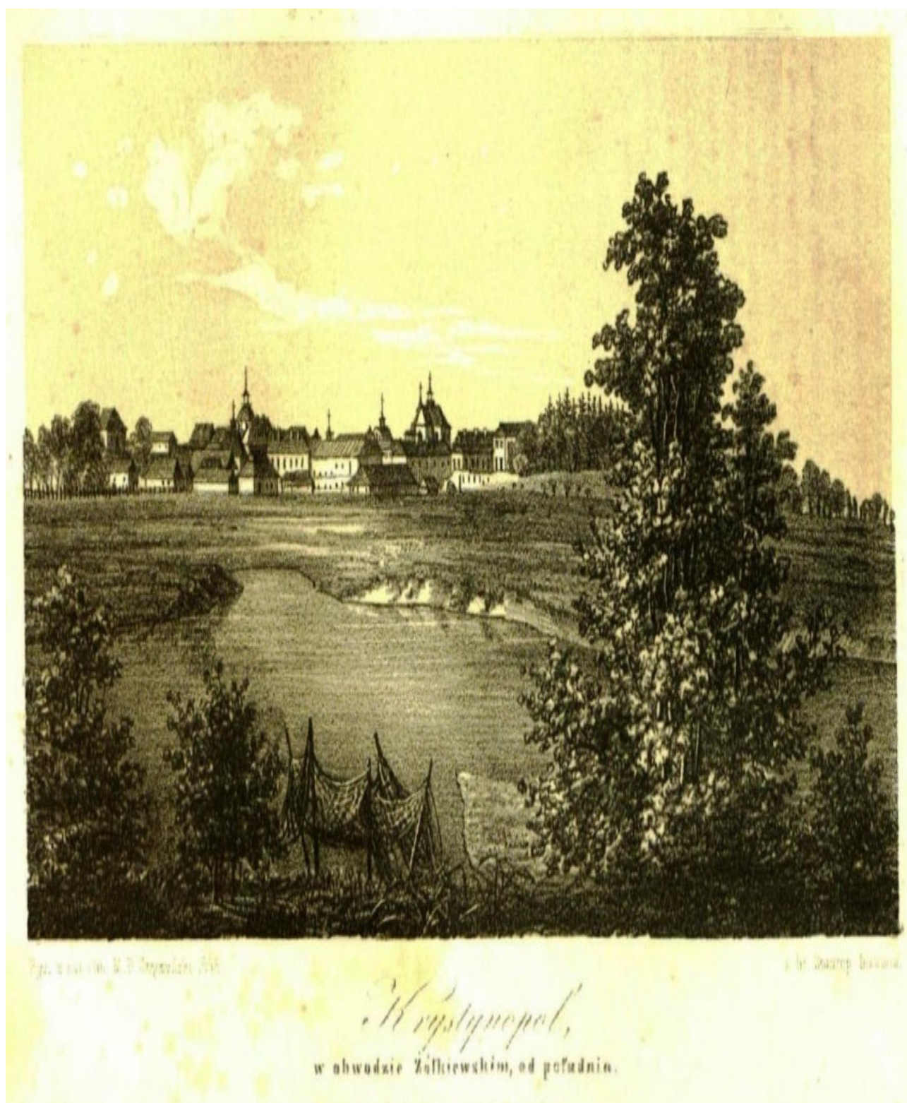
Фото. 1 Панорама Кристинополя, Б. Стенчинський, вид-во Р. Пилер. 1847 рік,