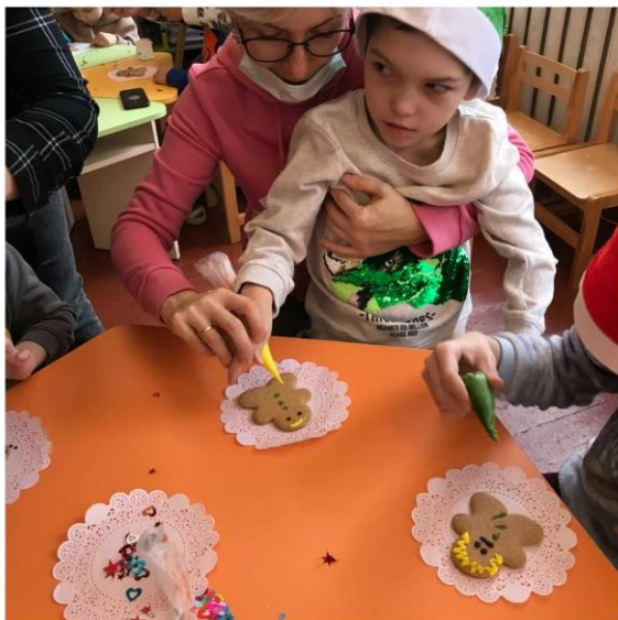
Фото участі в розмальовуванні імбирного печива, обирали найкращі візерунки, комунікація з дітьми з особливими потребами в процесі дозвілля