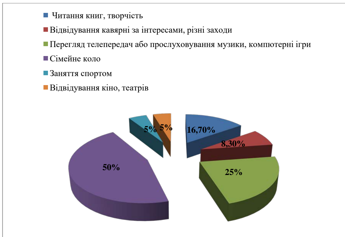
Рис. 2.1. Результати обробки відповідей на перше запитання анкетування дітей з особливими потребами

Результатами відповідей на друге запитання було співвідношення абсолютне розподілення 50% так і 50% ні. Діти чесно дали відповідь, що іноді їм некомфортно спілкуватися з дітьми, в яких немає особливих потреб. Переважна причина таких відповідей показала, що діти з особливими потребами мають не комфортні умови спілкування, так як мають труднощі в дозвіллі, тоді як інші діти без особливих потреб – не мають їх.