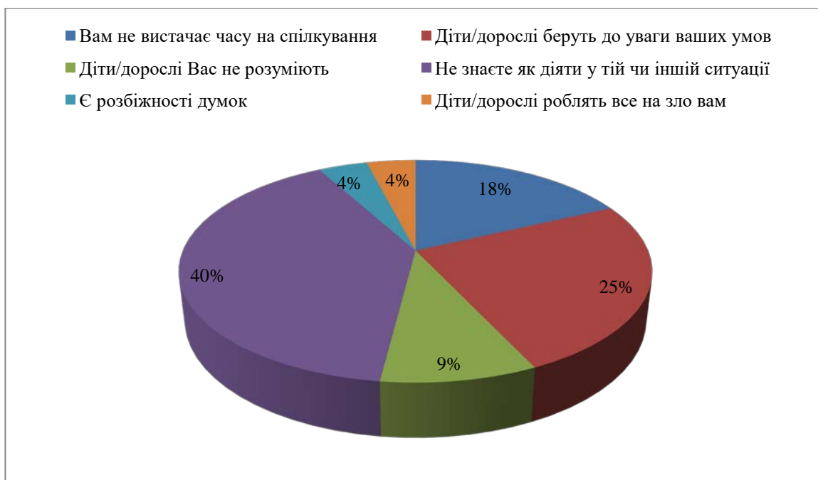
Рис. 2.3. Результати обробки відповідей на третє запитання анкетування дітей з особливими потребами

Переглянемо отримані відповіді на третє питання. Воно звучало так «Які труднощі Ви відчуваєте у спілкуванні з дітьми або дорослими?» (рис. 2.3).