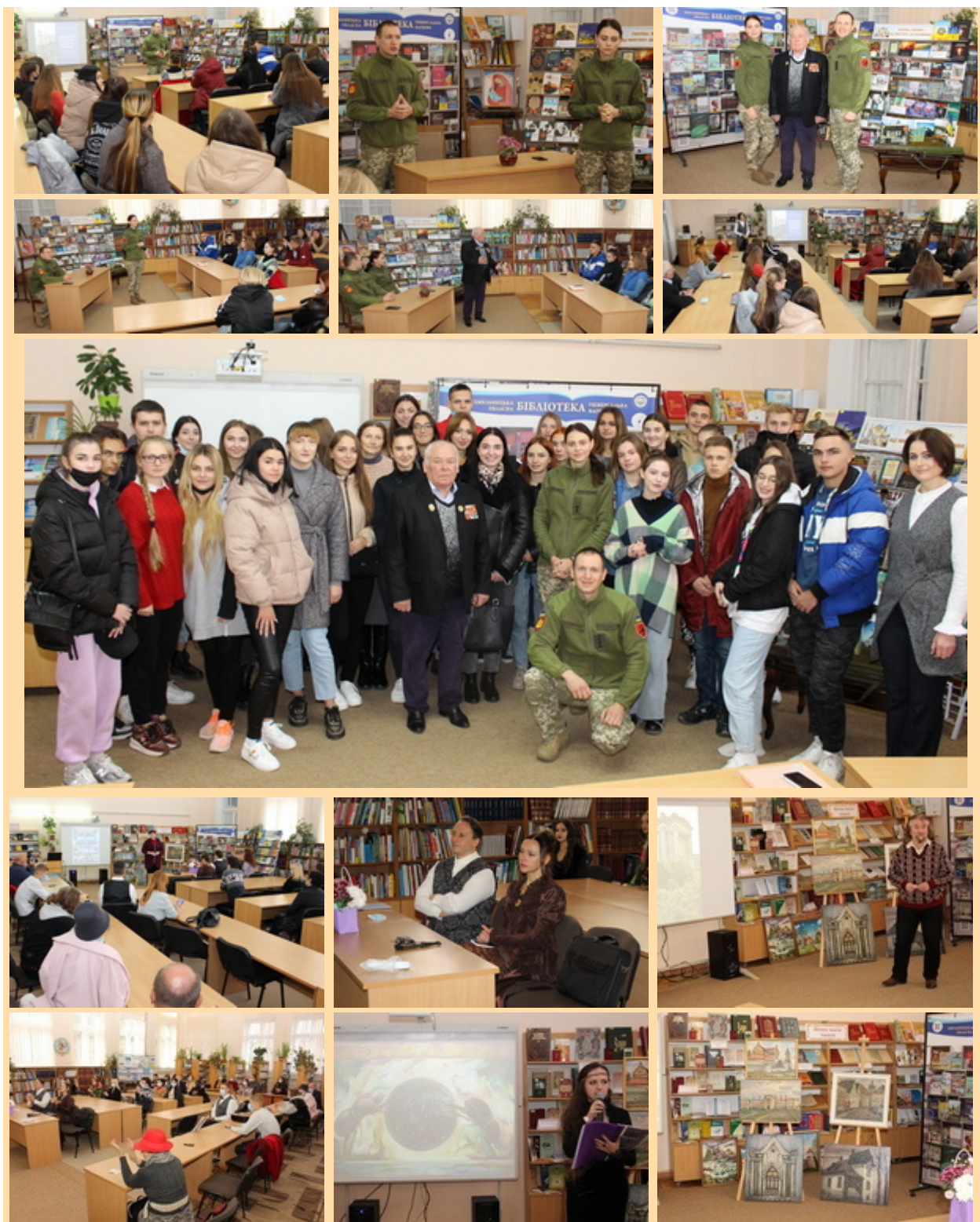
Хмельницька ОУНБ імені М. Островського. Творчий вечір «Музика в камені: архітектурні перлини Поділля, України та Європи».