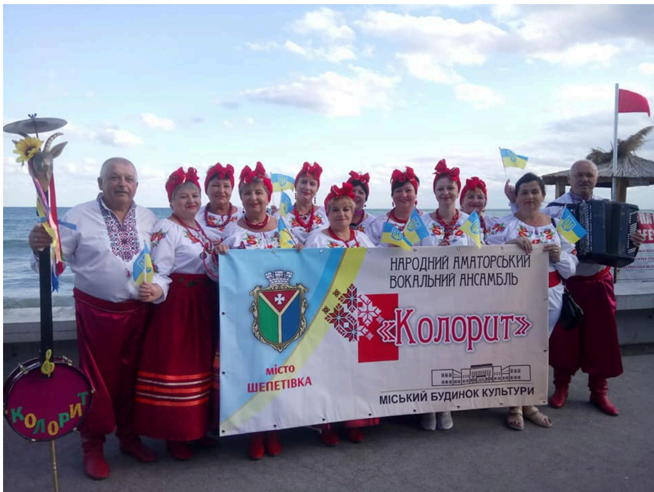
Колектив Народний аматорський вокальний ансамбль «Колорит»