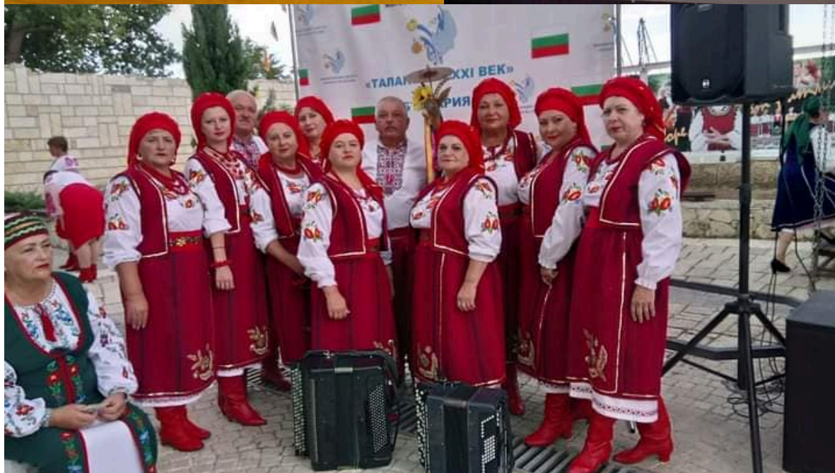
Народний аматорський вокальний ансамбль «Колорит», II премія у Міжнародному фестивалі «Таланти 21 століття» (м. Балчик, Болгарія, 04 - 08 .09. 2021 р.)