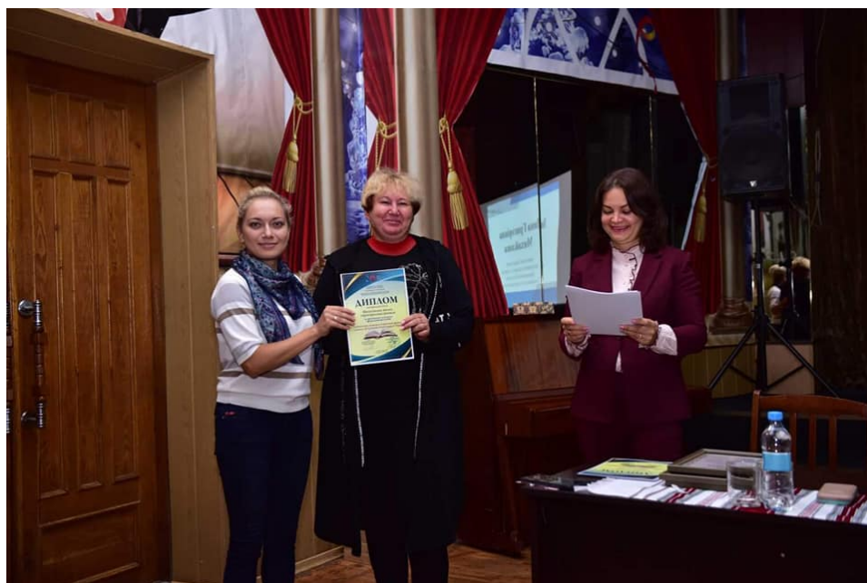
Керівник Шепетівського МБК - участь в обласному семінарі «Менеджмент креативних культурних індустрій» (м. Хмельницьк, Хмельницький бласний науково методичний центр культури і мистецтв)