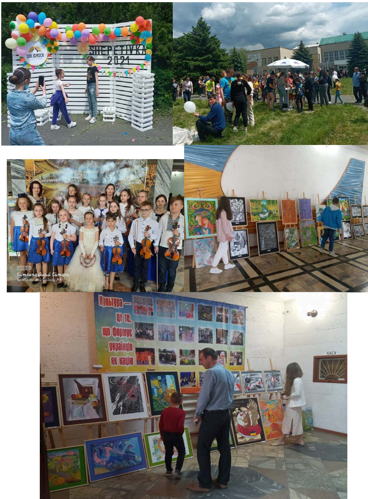
Фестиваль «Мистецьке коло» ((Шепетівський МБК)