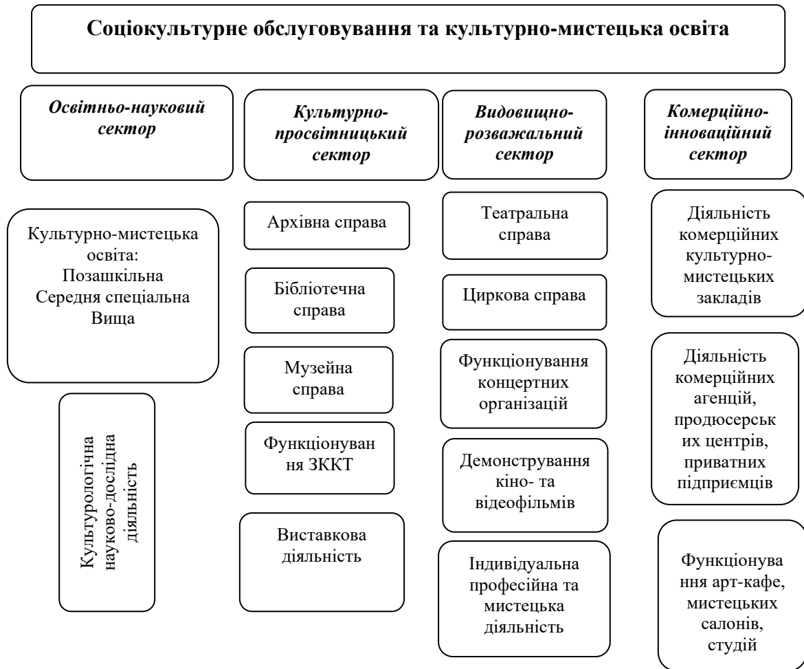
Рис. 1.1. Функціонально-компонентна структура культурно-мистецької галузі (розроблено на основі джерела [32]).

Формулювання терміну «культурно-мистецька галузь» сьогодні є найбільш актуальним і влучним, оскільки відповідає новітнім вимогам розвитку суспільства. Культура та мистецтво виконує конкретні функції і є лакмусом для суспільних перетворень, впливаючи на систему певного соціокультурного обслуговування населення.