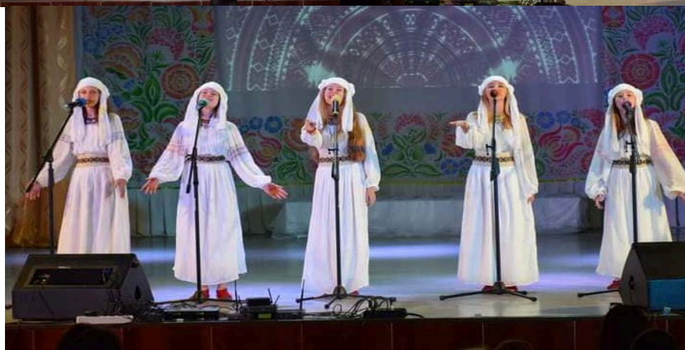
Тематичний захід, присвячений 30-й річниці Незалежності України «Україна. 30 кроків вперед» (Шепетівський МБК, 23.08. 2021р.)