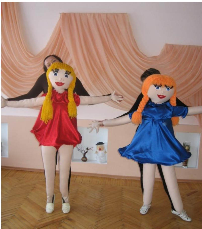
Театр «Веселих пальчиків»