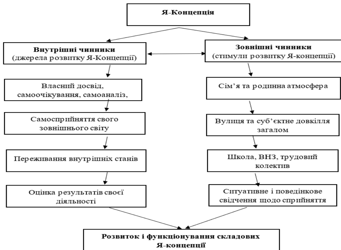
Рис. 1. Чинники розвитку Я-Концепції

Важливою ознакою підліткового періоду є фундаментальні зміни у сфері Я-концепції, які мають кардинальне значення для всього подальшого розвитку і становлення підлітка як особистості. Р.В.Павелків вважає, що «самосвідомість підлітка вже включає в себе всі компоненти самосвідомості дорослої особистості. Підліток сензитивний до свого духовного розвитку, тому він починає інтенсивно просуватися в розвитку всіх ланок самосвідомості. Підлітка починає хвилювати він сам у своєму фізичному і духовному втіленні. «Яким я можу постати перед іншими?» – актуальне запитання для нього» [1, с. 169].