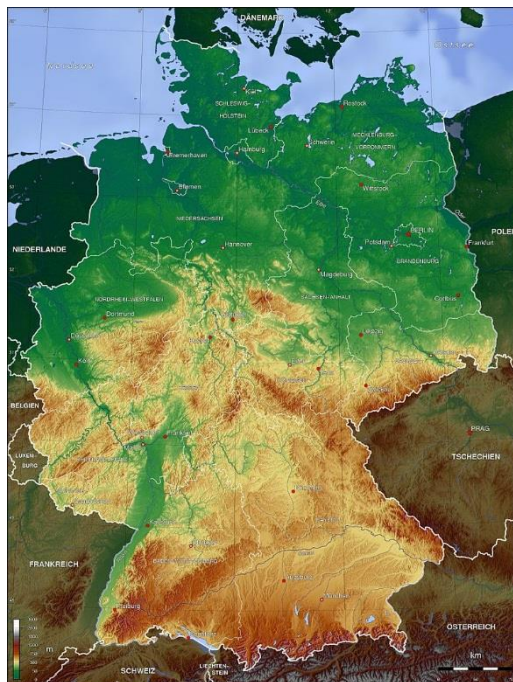
Рис. 4.2. Фізична карта Німеччини

Перш за все пропоную розглянути фізичну карту Німеччини, щоб більше дізнатися про рельєф даної країни.