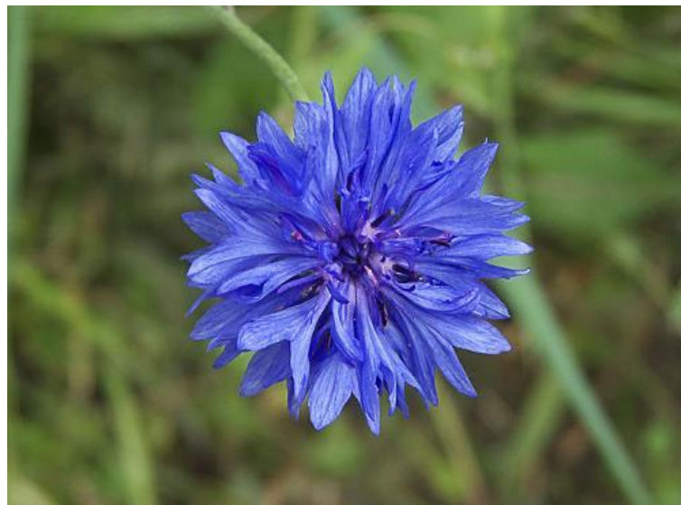
Рис. 2.4.1 Національна квітка Німеччини - волошка

Якщо говорити про рослинний покрив, то німецька флора належить до двох рослинно-географічних провінцій Євросибірського регіону: на крайньому північному заході до Атлантичної провінції, а в іншій частині Німеччини до Центральноєвропейської провінції. Окремим сектором є альпійська рослинність високогір'я. Національною квіткою Німеччини є волошка або холостяцький гудзик.