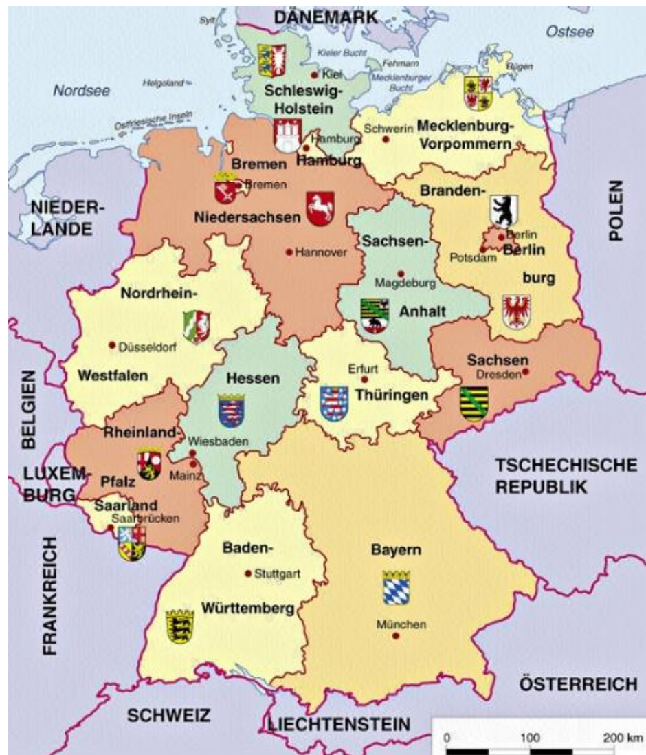
Рис. 2.1. Карта адміністративного поділу Німеччини

В адміністративному відношенні Німеччина поділяється на 16 федеральних земель, три з яких – Берлін, Гамбург, Бремен – є містами-землями [5].