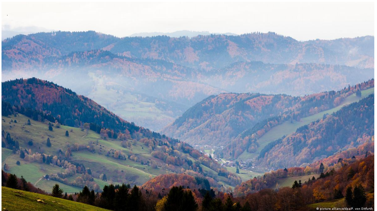
Рис. 4.2.2 Національний парк Шварцвальд

Наступна зупинка нашої віртуальної подорожі є для того, щоб більше познайомитися з природою Німеччини. Це буде Національний парк Шварцвальд.