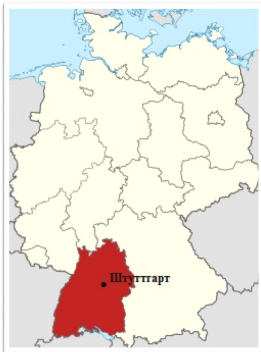
Рис. 3.4. Положення регіону Баден Вюртемберг на карті Німеччини

Географія регіону. За площею та чисельністю населення Баден-Вюртемберг займає третє місце серед німецьких земель. На площі 35 751 квадратних кілометрів проживає близько 10,8 мільйонів людей. Баден-Вюртемберг, розташований у південно-західній частині Німеччини та сусідній з трьома іншими німецькими державами, лежить у самому серці Європи та має спільні кордони з трьома європейськими країнами.