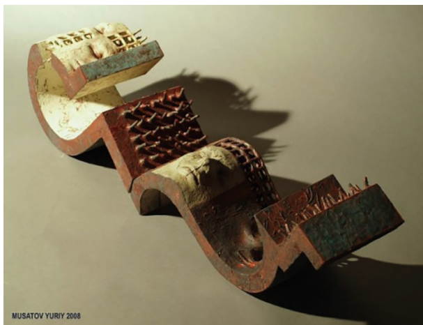
Рис 2. Юрій Мусатов. «Хто я? Звідки я? Куди йду?», Вроцлав, 2008 р. (Частина 2). Фото: http://poglyad.com/blog-21/post-379