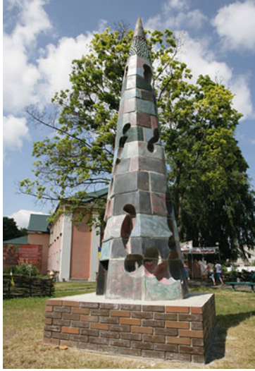
Рис. 4. Юрій Мусатов. Вежа. с. Опішне, Полтавська область, 2013 р.