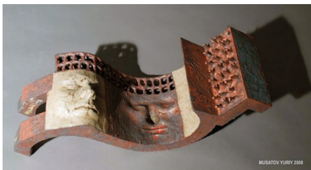
Рис 1. Юрій Мусатов. «Хто я? Звідки я? Куди йду?», Вроцлав, 2008 р. (Частина 1).

Кожна робота Ю. Мусатова, безумовно, з чимось пов'язана. Це може бути історія, переживання, запах, колір, асоціація. І, звичайно ж, усі вони особисті. Наприклад, «Портрет Невідомого» – це керамічна композиція, над якою кераміст-дизайнер працював у Вроцлавській Академії Мистецтв у 2008 р., одразу по закінченню ЛНАМ і отримав стипендію Gaude Polonia міністерства культури Польщі. Композиція складається з трьох основних об'єктів, які націлюють глядача замислитися над такими питаннями: «Хто я? Звідки я? Куди йду?» (Рис. 1, Рис. 2, Рис. 3.).