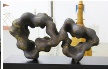
Рис. 5. Юрій Мусатов. «Хмара» (2015 р., колекція «Еволюція хмари»).