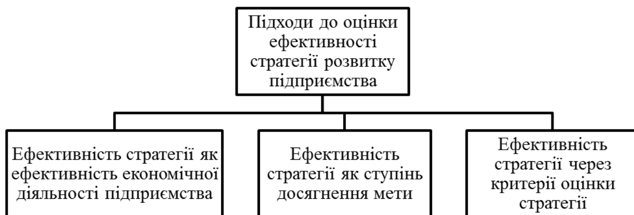
Рис. 2. Основні підходи до оцінки ефективності стратегії

У практиці виділяють три основних підходи до оцінки ефективності стратегії розвитку підприємства, зазначених на рис. 2. Кожен з підходів спирається на власну теоретичну базу, використовується для різних видів стратегій та має власні плюси та мінуси.