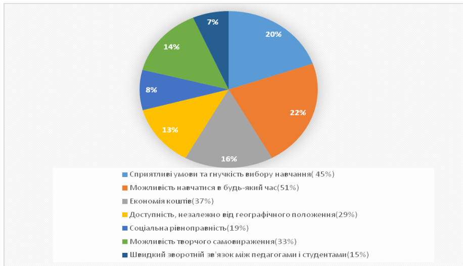
Рис. 1. Переваги дистанційної форми навчання очима здобувачів вищої освіти