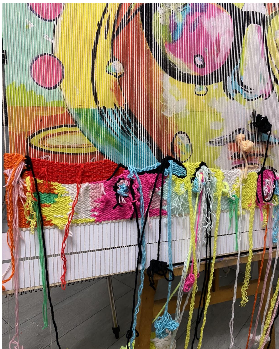
Рис. 2. Процес виконання роботи.