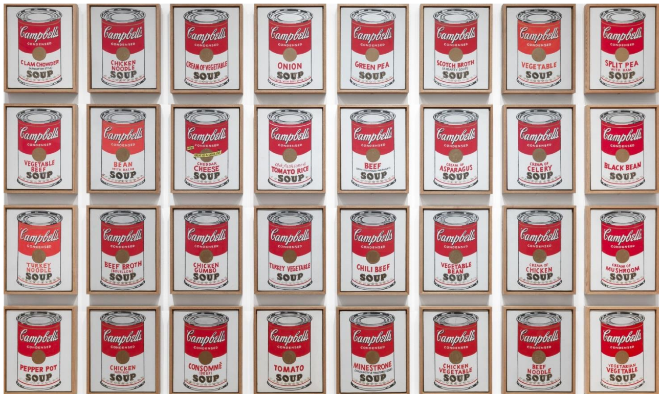
Рис. 1. Консервні банки з супом «Кемпбелл» (Тридцять дві банки супа Кемпбелл). Енді Воргол 1962.