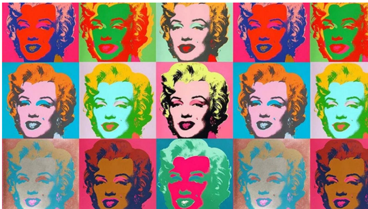
Рис. 2. Marilyn Monroe (Мэрилин Монро). Енді Воргол. 1968