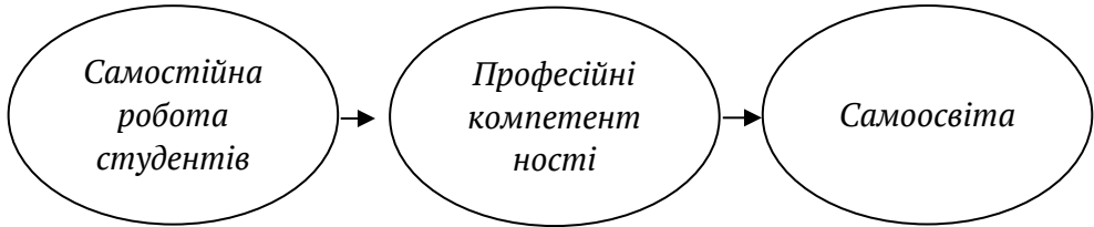
Рис. 3. Взаємозв'язок понять «самостійна робота студентів», «професійні компетентності», «самоосвіта».

готовності до виконання професійних функцій. Дана компетентність конкретизується низкою наступних професійних компетентностей, а саме: інформаційна, комунікативна, продуктивна, моральна, психологічна, предметна, соціальна, математична, здатність до саморозвитку і самоосвіти, а також особистісні якості вчителя. Цей взаємозв'язок можна показати наступним рисунком: