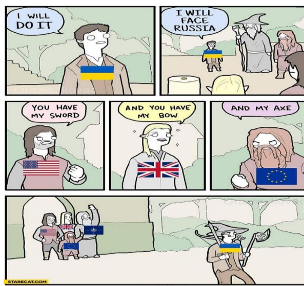
Meme from StareCat

There have been several memes floating around the internet about the West's lack of response to the crisis happening in Ukraine. Like this one: