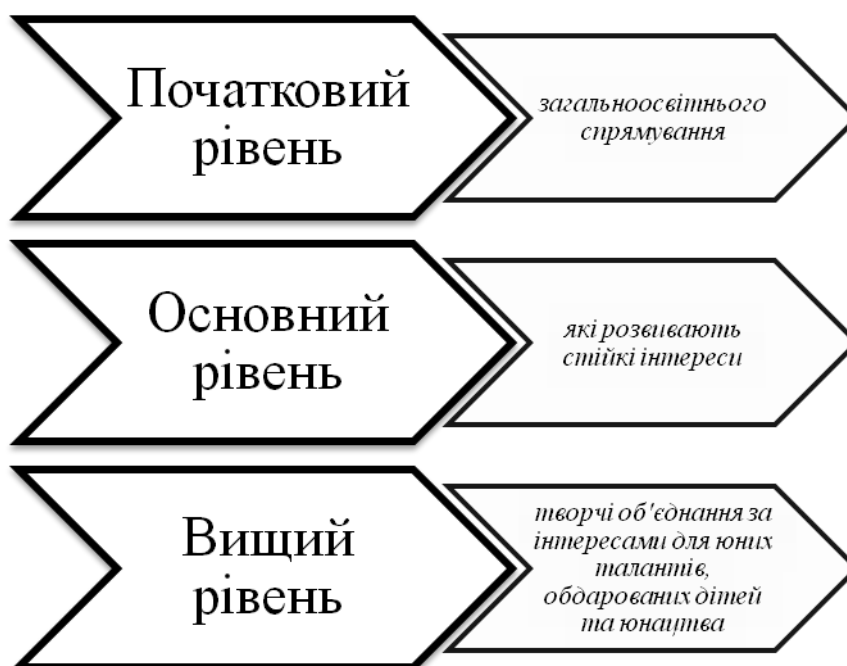
Рис. 1.1. Рівні творчих об'єднань для художнього розвитку

Професійно організована позанавчальна діяльність має особливе значення у формуванні особистості учнів, розширенні та поглибленні їхніх знань та розвитку творчих здібностей. Тому важливу роль у розвитку творчої особистості відіграє вчитель. Він виконує важливу місію, залучаючи учнів до суспільно корисної діяльності, стимулюючи їхню ініціативу і самостійність, а також розвиваючи їхні індивідуальні інтереси, схильності і здібності. Специфіка педагогічного керівництва в цьому аспекті полягає у впливі на формування життєвої позиції учнів, орієнтованої не лише на уроки, а й на широкий спектр позакласних заходів. Учитель, за словами О.Мелентьєва активно включає учнів у різноманітні види творчості, спонукає їх до розвитку інтересу до техніки і праці, формуючи в них комплексні навички та цінності [ с. 33].