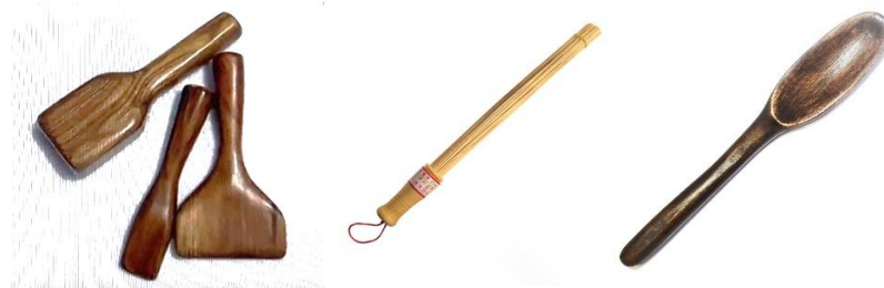
Рис. 3. Засоби для проведення Східного масажу

Також ми формували здоров'язберігаючу компетентність у майбутніх фахівців фізичної терапії (II-IV-го курсів) на базі навчально-наукового реабілітаційного центру (гуртожиток № 5) РДГУ, реабілітаційного центру Рівненської обласної лікарні ім. Ю. Семенюка, КЗ «Рівненського обласного госпіталю ветеранів війни» у процесі проходження Тижня фізичної терапії та реабілітації 18-20 жовтня 2023 року [3; 5-6].