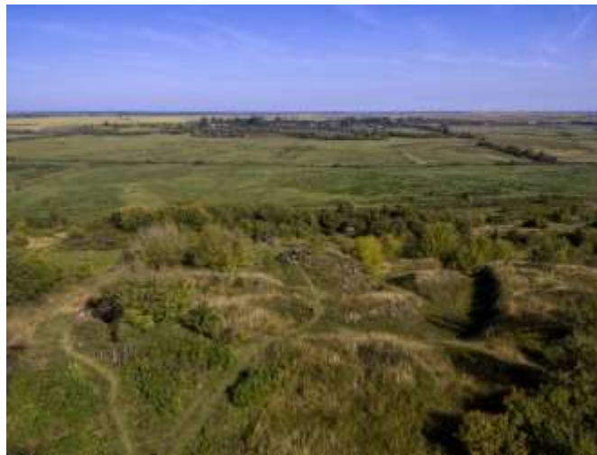
Рис. 2.29. Пам'ятка археології. Городище літописного міста Дорогобуж у с. Дорогобуж [19]

дивитися з пагорба Успенської церкви, на якому видно давні вали. На початку ХХ століття залишки старого замку, включаючи круглу вежу з потужними контрфорсами та готичними вікнами, були ще видимими, що задокументовано Мечиславом Орловичем у його «Путівнику по Волині» (1929 р.). Незважаючи на стратегічне розташування замку, він піддався плину часу, людській діяльності та мінливим обставинам [18].