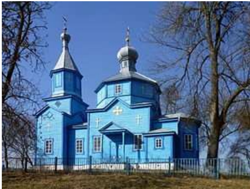
Рис. 2.15. Пам'ятка архітектури Західного Полісся. Церква Св. Василя Великого у с. Красностав[61]

року, з подальшою реконструкцією у 1902 році. Цей історичний зв'язок підтверджується записами з метричних книг 1841 року Свято-Спаської церкви у Гнійному. Протягом усієї своєї історії ця церква залишалася осередком для громади, непохитно виконуючи своє служіння, незважаючи на політичну кон'юнктуру. Розташована в південній частині Красностава на рівній місцевості вздовж сільської дороги, церква обнесена невисоким кам'яним парканом. Триповерхова споруда з одним дахом має вівтар, з обох боків оточений ризницями. Крім того, помітними архітектурними елементами є два бічні входи до нави та традиційна дерев'яна дзвіниця на західному бабинецькому фасаді. Дах дзвіниці був замінений на початку 2010-х років. Верхні дерев'яні конструкції церкви були відремонтовані, а дах перекритий новою бляхою. У восьмерику встановили пластикові вікна, а в інтер'єрі розпочався проект розпису [84].