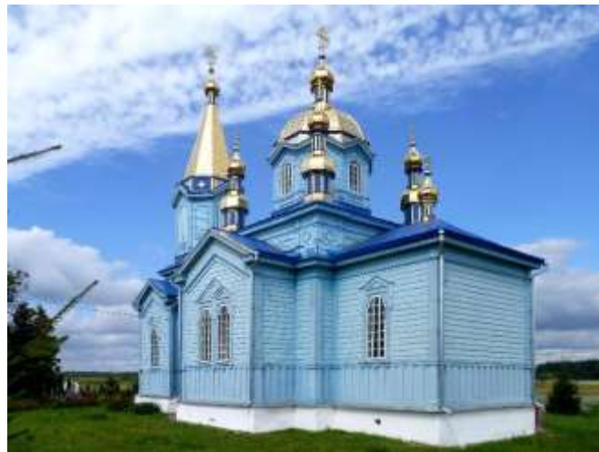
Рис. 2.10. Пам'ятка архітектури Західного Полісся. Церква Різдва Богородиці у с. Губин [70]

Одним із яскравих прикладів архітектурної пам'ятки сакральних споруд є Губинська церква Різдва Богородиці, яка була зведена за церковним проектом у 1900 році. Розташована на північній околиці Губина, вздовж дороги, що веде до села Тумин, церква знаходиться на значній відстані від головних споруд села. Центральна нава церкви фланкується дещо вужчими прибудовами з усіх чотирьох боків, зокрема віттарем зі сходу, бічними прибудовами з півночі та півдня і бабинцем із заходу. Існує ймовірність, що до північної стіни віттаря прилягала ризниця. Крім того, до західного боку бабинця прибудована одноярусна дерев'яна дзвіниця. Конструктивний каркас цієї церковної споруди спирається на відносно підвищений фундамент. По кутах чотирисхилого даху, що увінчує центральну наву, прикрашають двоярусні ліхтарі з виразними маківками. Ці ліхтарі, а також маківки і закомаринави та дзвіниці обшиті блискучою жовтою бляхою, а покрівельні конструкції піддані перефарбуванню [81].