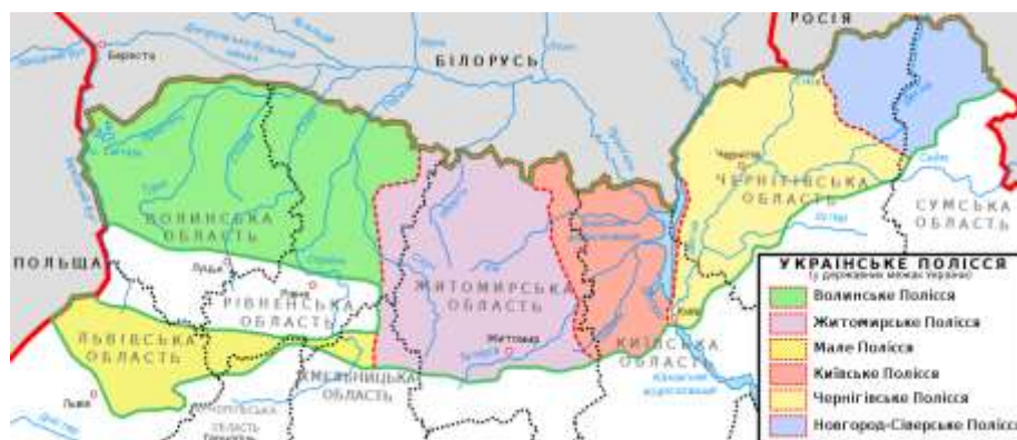
Рис. 1.1. Територія Західного (Волинського) Полісся на карті України [69]

Західне Полісся (Волинське Полісся) - це історико-культурний регіон, розташований у північно-західній частині України на території Волинської та Рівненської областей (див. Рис. 1.1.). Протягом років Західне Полісся приваблювало науковців, істориків та культурологів з усього світу, які проводили тут свої численні дослідження.