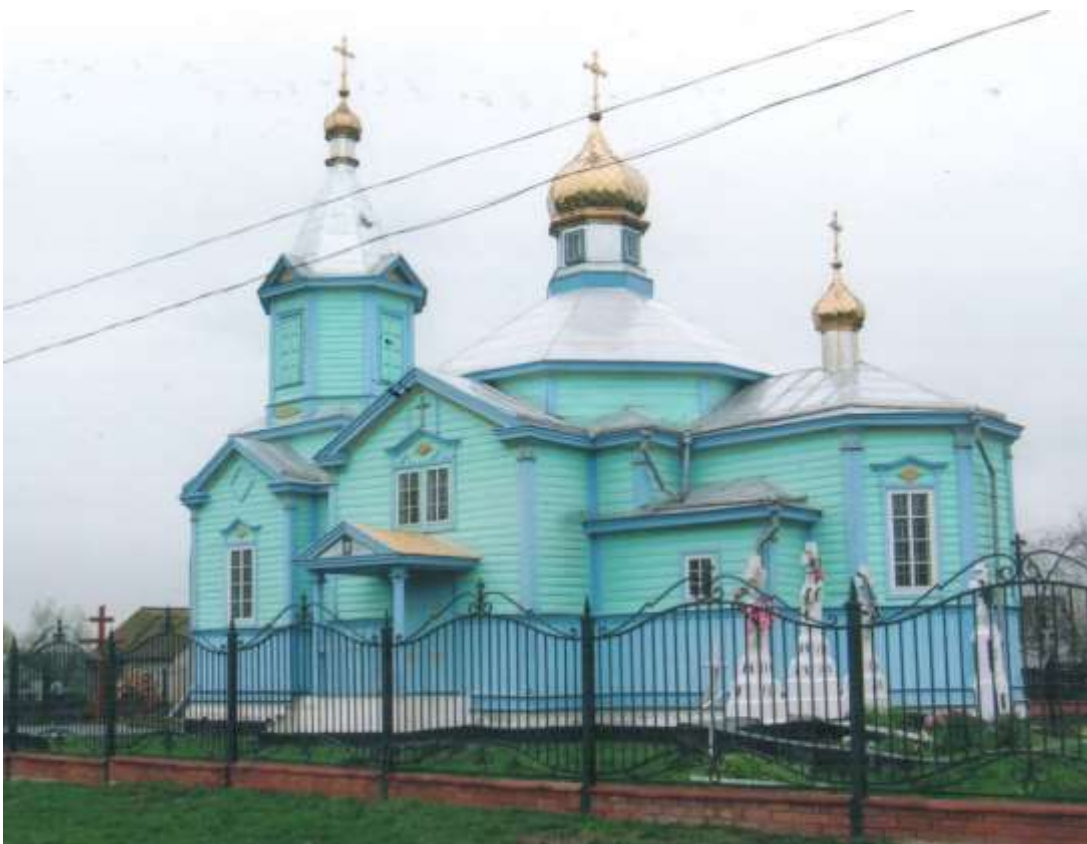
Рис. 2.16. Пам'ятка архітектури Західного Полісся. Церква Різдва Пр. Богородиці у с. Сусваль [67]

єпархіального стилю. Примітно, що кінець нави має унікальні архітектурні характеристики, а до вівтаря з обох боків продумано прибудовані ризниці. Традиційна дерев'яна дзвіниця прикрашає західний фасад Бабинця, слугуючи його визначальною рисою. Нещодавні зусилля з реконструкції церкви принесли свої плоди: дах і верхня частина бабинця були замінені на нову бляху. Фасади церкви випромінюють відчуття оновлення та яскравості, що значною мірою пов'язано з їхнім зовнішнім виглядом, з темно-синіми карнизами, кутами стін та віконними рамами, доповненими темно-жовтими акцентами, які підвищують загальну естетичну привабливість [82].