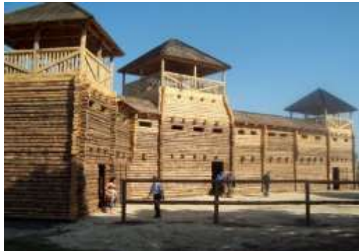
Рис. 2.32. Пам'ятка археології Західного Полісся. Городище у с. Пересопниця [47]

У 1630 році, після Берестейської унії, монастир Різдва Пресвятої Богородиці був назавжди переданий Клеванському єзуїтському колегіуму, а згодом розібраний. Відтоді Пересопниця перетворилася на особливе волинського села, яке поступово повертає собі втрачену історію і перетворюється на живий туристичний центр. До пам'яток національного значення у с. Пересопниця належить городище літописного міста, що датується XI-XIII століттями. Розташоване на мисовому укріпленні в урочищі Шпихлір на західній околиці сучасної Пересопниці, це городище «олинського типу», трапецієподібної форми із заокругленим південним кутом, займає площу понад шість гектарів [46].