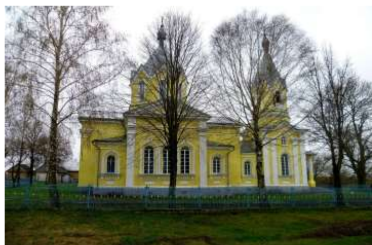
Рис. 2.14. Пам'ятка архітектури Західного Полісся. Церква Флора і Лавра у с. Яковичі[100]

Понад 155-річною історією славиться також і церква Флора і Лавра у с. Яковичі, яку почали будувати ще у 1865 році, а завершили будівництво у 1877 році. Тривалий час храм залишався занедбаним. Однак, завдяки відданості, фінансовій підтримці та щирим молитвам громади Яковичів, церква була відроджена і зараз вітає людей зі щирою вірою, які бажають поклонитися і служити Богу [2].