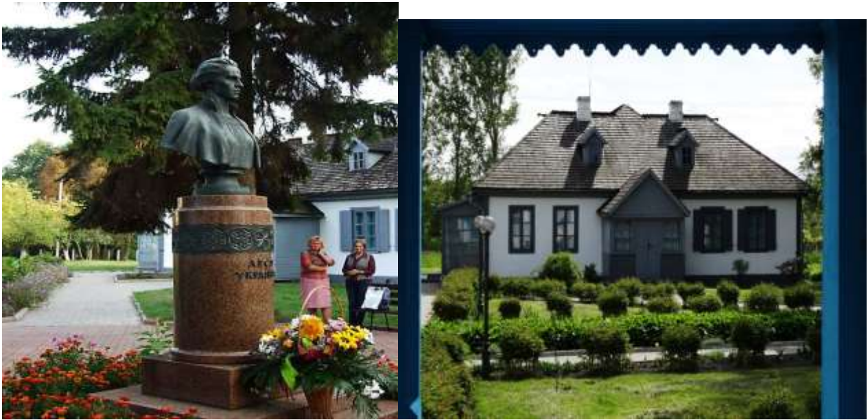
Рис. 2.5. Пам'ятка історії Західного Полісся. Садиба поетеси і громадської діячки Лесі Українки у с. Колодязне [32;59]

Відомим у контексті історико-культурних пам'яток Західного Полісся є і невеличке село Затурці поблизу якого знаходиться древнє городище – архелогічна пам'ятка, датована 11-13 століттям. Це городище має форму неправильного поселення овальної форми, розміром 60 на 150 метрів. Городище оточувала фортифікаційна стіна, ширина якої сягає 7 метрів, а висота - до 4 метрів. В'їзд на городище розташований зі східної сторони. Рельєф місцевості загалом рівний. В межах цієї локації археологи знайшли чимало артефактів, переважно керамічні вироби [23].