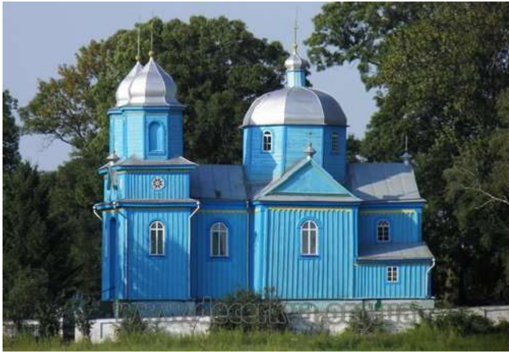
Рис. 2.12. Пам'ятка архітектури Західного Полісся. Церква Собору Пр. Богородиці 1778, ХІХ століття у с. Микуличі [80]

Не менш відомою пам'яткою Західного Полісся є і дерев'яна церква у с. Хворостів на північ від с. Микуличі. Вважається, що перша церква в цьому селі була заснована в 16 столітті. У 1876 році (хоча деякі джерела вказують на 1884 рік) на місці колишнього храму було зведено нову дерев'яну церкву, збудовану в епархіальному архітектурному стилі. Ця споруда була присвячена Воздвиженню Чесного Хреста Господнього. Розташована на пологому схилі на північній околиці села, церква являє собою скромну триярусну дерев'яну споруду. З північного боку до вітваря примикає невелика ризниця, а над Бабинцем височіє двоярусна дерев'яна дзвіниця. Оригінальні вікна в церкві замінені на сучасні пластикові аналоги, а зовнішні стіни, не отримували свіжого шару фарби протягом тривалого періоду. Помітні дерев'яні хрести прикрашають як восьмигранні стіни, так і другий ярус дзвіниці. Особливо привертають увагу витіюваті гратчасті ліхтарі зі шпильями, що увінчують восьмигранні верхи як нави, так і дзвіниці [80]. Ця пам'ятка також є предметом уваги місцевої громади для використання її з туристичною метою.