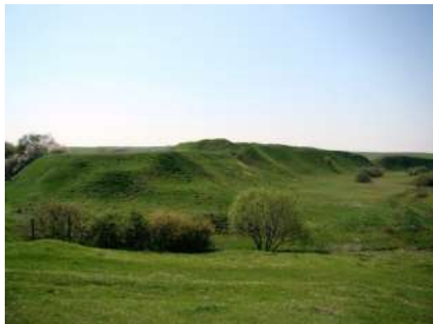
Рис. 2.3. Пам'ятка археології Західного Полісся. Городище у м. Зимне [64]

Знахідки також вказують на наявність різних ремесел в межах укріплених ділянок, включаючи обробку кістки, ковальство та ювелірну справу. Зокрема, виробництво бронзових, срібних та залізних прикрас, таких як браслети та пряжки (одна з яких нагадує птаха), було ключовим видом діяльності. Крім того, збереглися залишки ливарних форм, тиглів і ковадлів, які пережили випробування часом. Крейдяні пряслиця вигадливої форми свідчать про використання токарного верстата для обробки каменю. Серед визначних знахідок - візантійська монета із зображенням імператора Юстина або Юстиніана. Близько середини сьомого століття нашої ери поселення, зазнавши значних руйнувань від аварів, припинило своє існування. Історики припускають, що частина мешканців Зимного після зруйнування їхнього поселення обрала своїм новим домом місцевість, на якій нині розташоване місто Володимир [64].