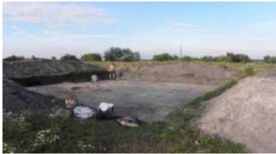
Рис. 1.26. Пам'ятка археології Західного Полісся. Древньоруське городище у с. Шацьк [16]

Розташоване на східній околиці Шацька біля озера Люцимир, це городище, відоме під місцевими назвами «Гора» або «Сад» [27].