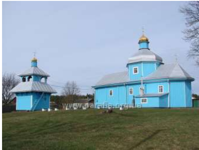
Рис. 2.21. Пам'ятка архітектури Західного Полісся. Церква Успіння Пресвятої Богородиці у с. Оконськ разом з дзвіницею [1]

Церква Святої Параскеви, побудована в 1787 році в історичному селі Підгірне (попередня назва - Малі Березолупи), є ще одним свідченням багатой культурної та історичної спадщини регіону. Первісно ця церква, ймовірно, була призначена для розміщення обмеженої кількості парафіян через її скромні розміри та архітектуру, якщо припустити, що вона залишалася незмінною протягом наступних століть. За радянських часів храм був занедбаний.