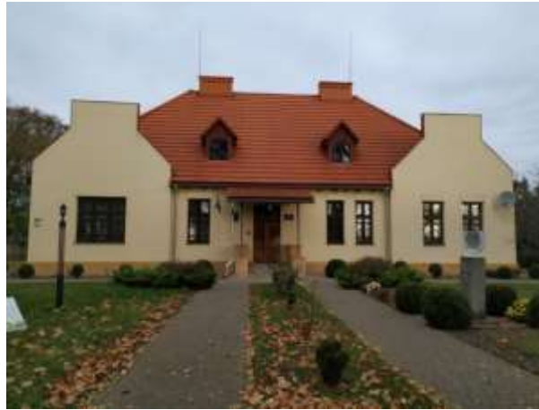
Рис. 2.4. Пам'ятка історії Західного Полісся. Будинок композитора І. Ф. Стравінського у м. Устилуг [8]

Західне Полісся відоме для літературознавців та етнографів також і тим, що було «коханою батьківщиною» відомої української поетеси та письменниці Лесі Українки. Тут пройшли її дитячі та юнацькі роки після того, як у травні 1882 року родина Косачів переїхала з Луцька до села Колодяжного. Родина Косачів дуже любила свій новий дім, висловлюючи свої почуття в листах до друзів: "По правді кажучи, Колодяжне - це дім, а решта так собі».