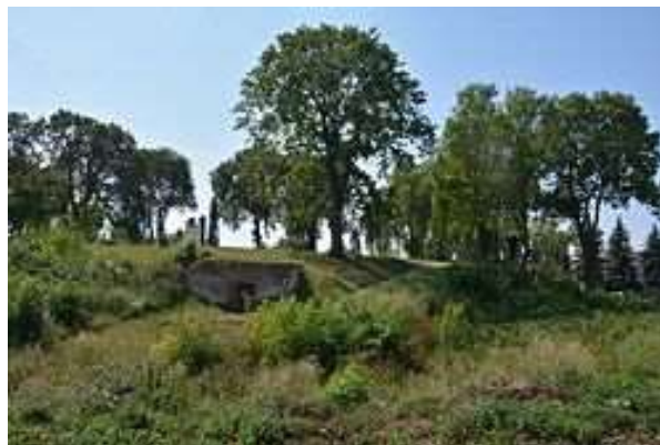
Рис. 2.8. Пам'ятка археології Західного Полісся. Городище «Замчище» у м. Любомль [74]

Історично на території городища стояв замок з підйомним мостом та адміністративними приміщеннями. Перша документальна згадка про замок з'являється наприкінці чотирнадцятого століття, а остання - у 1773 році. У XVIII столітті прилеглі землі, що оточували тодішній Любомльський замок, мали назву «Підзамче». Згідно з місцевими переказами, тут існував підземний хід, що простягався з-під замкового пагорба на південь. У 1969 році городище Замчище, або Замкова гора, було визнано пам'яткою археології і передано під охорону Волинського облвиконкому. Знахідки з археологічних розкопок нині зберігаються в Любомльському краєзнавчому музеї. За часів Радянського Союзу на вершині пагорба було встановлено меморіал пам'яті воїнів Другої світової війни. Земляні замкові вали у Любомлі Волинської області, які охоплюють період з XIII по XVIII століття, демонструють досить незвичну оборонну систему і вважаються археологічною пам'яткою національного значення [15].