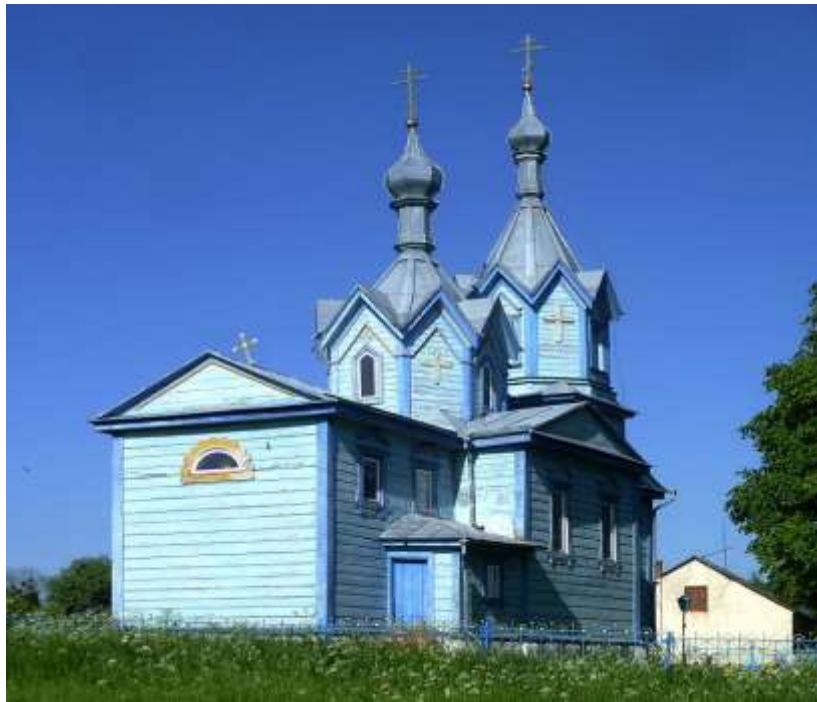
Рис. 2.13. Пам'ятка архітектури Західного Полісся. Церква Воздвиження Чесного Хреста у с. Хворостів [73]

Понад 155-річною історією славиться також і церква Флора і Лавра у с. Яковичі, яку почали будувати ще у 1865 році, а завершили будівництво у 1877 році. Тривалий час храм залишався занедбаним. Однак, завдяки відданості, фінансовій підтримці та щирим молитвам громади Яковичів, церква була відроджена і зараз вітає людей зі щирою вірою, які бажають поклонитися і служити Богу [2].