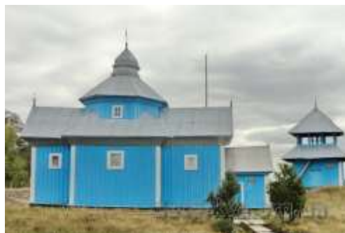
Рис. 2.20. Пам'ятка архітектури Західного Полісся. Церква св. Дмитра у с. Нова Руда разом з дзвіницею

Привертає увагу науковців та любителів архітектури і невеличке село Нова Руда Маневицького району, у якому розташована дерев'яна церква на честь святого Дмитра разом із дзвіницею, яка була побудована в 1742 році (або, за іншими історичними свідченнями, в 1792 році). Дослідники сходяться в думці, що вона витримала плин часу, не зазнавши значних структурних змін. Розташована на східній околиці західного сектору Нової Руди, ця невелика триповерхова церква відповідає волинському архітектурному стилю. Характерно, що вона складається з двох прибудов до основної споруди. На захід від бабинця знаходиться стрункіший притвор, а на південь від нави - мініатюрна ризниця. Особливими рисами споруди є помітно широкі карнизи та компактні пропорції восьмигранної нави, яку увінчує ліхтар, увінчаний маківкою, прикрашеною шпилем. З південно-західного боку до храму прилягає дерев'яна двоярусна дзвіниця, яка доповнює загальний архітектурний ансамбль [85].