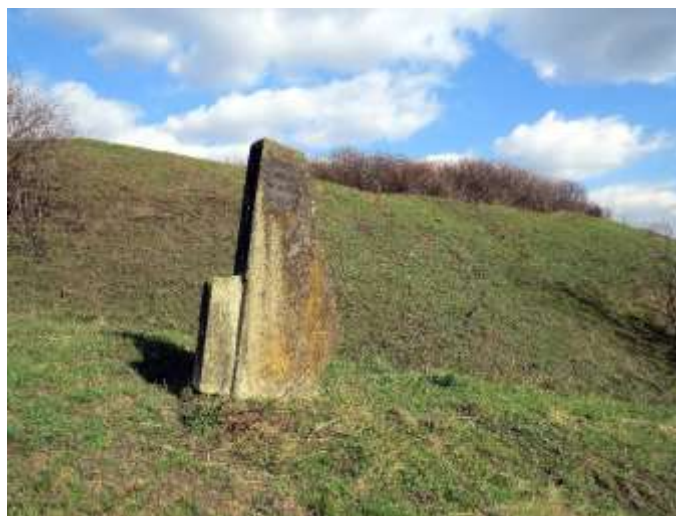
Рис. 2.6. Пам'ятка археології Західного Полісся. Городище на околиці с. Затурці [77]

Відомим у контексті історико-культурних пам'яток Західного Полісся є і невеличке село Затурці поблизу якого знаходиться древнє городище – архелогічна пам'ятка, датована 11-13 століттям. Це городище має форму неправильного поселення овальної форми, розміром 60 на 150 метрів. Городище оточувала фортифікаційна стіна, ширина якої сягає 7 метрів, а висота - до 4 метрів. В'їзд на городище розташований зі східної сторони. Рельєф місцевості загалом рівний. В межах цієї локації археологи знайшли чимало артефактів, переважно керамічні вироби [23].