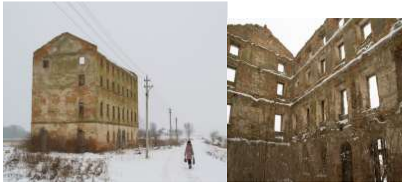
Рис. 2.24. Пам'ятка історії Західного Полісся. Млин у с. Зимне [26]

У доволі прикрому стані знаходиться зараз й інша пам'ятка історії та архітектури Західного Полісся – будинок Г. Носенко, датований початком ХХ століття, який знаходиться у м. Устилуг. Колись, велична будівля, яка відображала стиль українських традицій архітектури тієї епохи перебуває у занедбаному стані та поступово руйнується.