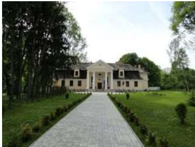
Рис. 2.7. Пам'ятка історії Західного Полісся. Садиба родини Липинських у с. Затурці [58]

маєток має особливе історичне значення, оскільки він був батьківщиною видатного історика В'ячеслава Липинського. Слід зазначити, що під час Першої світової війни маєток зазнав повного руйнування. На його місці було зведено величний двоповерховий палац, але під час Другої світової війни верхній поверх цього палацу був знищений пожежею. Починаючи з 1990 року, були розпочаті роботи з історичного відновлення маєтку. Згодом, у 1995 році, муніципальна влада санкціонувала реконструкцію будинку, визначивши його як музей [6].