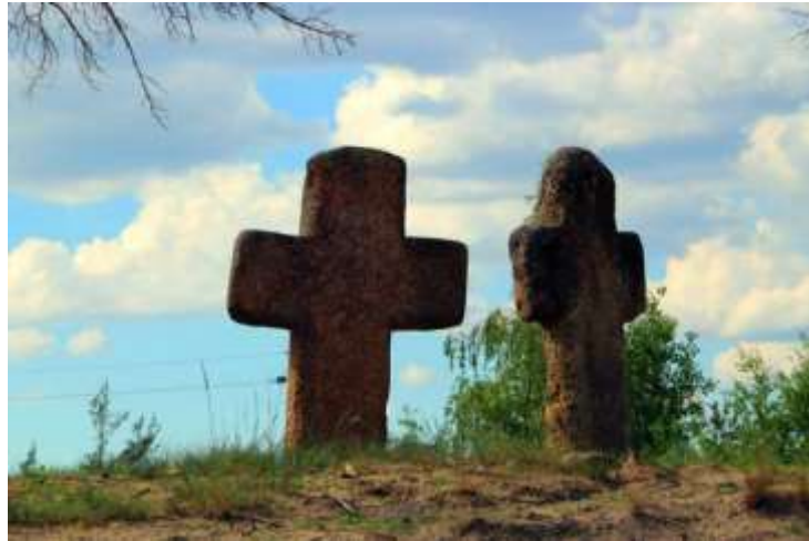
Рис. 2.33. Пам'ятка археології Західного Полісся. Курганний могильник у с. Глинне [13]

Автор провів аналіз пам'яток Західного Полісся національного значення, відповідно до Державного реєстру нерухомих пам'яток України, розташованих на території Рівненської області [45]. Це комплексне дослідження охоплює різні історичні та культурні об'єкти. З метою підвищення доступності та сприяння всебічному розумінню культурної спадщини, результати цього аналізу були систематизовані та представлені у вигляді зведеної таблиці.