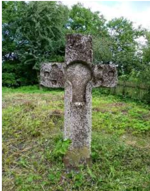
Рис. 2.23. Пам'ятка історії Західного Полісся. Курган з кам'яним Хрестом у с. Зимне [78]

і виявили його значну висоту - 308 сантиметрів, з яких 205 сантиметрів виступають над поверхнею. Горизонтальна перекладина простягається на 108 сантиметрів. Прикметно, що ретельно збережені пропорції та майстерність виконання хреста вказують на роботу висококваліфікованого каменяра. Цікаво, що Зимненський хрест має кілька заглиблень, можливо, призначених для розміщення ікон та барельєфного зображення розп'яття. Слід зазначити, що місцеві краєзнавці стверджують, що колись під горизонтальними опорами хреста міг проїхати вершник на коні. Крім того, навколо цього місця збереглися різні легенди. Вважається, що щороку на Юрійів день з-під фундаменту хреста виходить давньоруський воїн, який своїм мечем відганяє русалок з Лугу. Опівдні тінь від хреста вказує на заховані скарби [46].