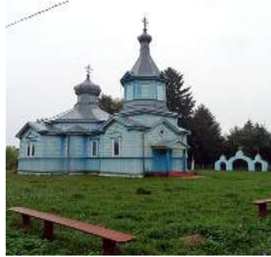
Рис. 2.11. Пам'ятка архітектури Західного Полісся. Церква св. Миколая у с. Тумин [72]

шатровий дах, увінчаний великим ліхтарем з орнаментальною маківкою. До вівтаря прилягають дві ризниці, а до бабинця прибудована традиційна, ширша, дерев'яна, двоярусна дзвіниця. Оригінальні вікна були замінені на пластикові, а зовнішні стіни тривалий час залишалися не пофарбованими [87].