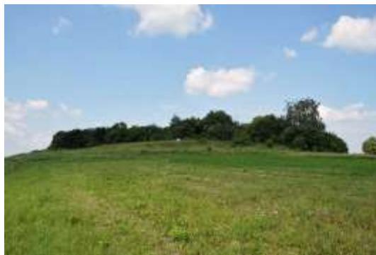
Рис. 2.27. Пам'ятка археології Західного Полісся. Древньоруське городище у с. Новий Двір

Менш відомим, однак цінним з історичної точки зору є і археологічна пам'ятка доби Київської Русі, що датується IX-XIII століттями – городище у с. Новий Двір Ковельського району. Городище містить давньоруські артефакти, розташована на заболочених луках [3].