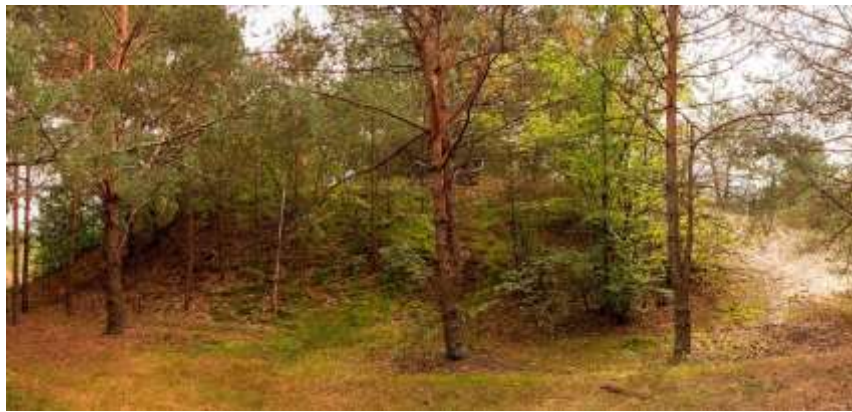
Рис. 2.27 Пам'ятка археології Західного Полісся. Древньоруське городище у с. Бабка [68]

Історик Володимир Рожко стверджує, що Бабчинський замок відіграв ключову роль у регіональному економічному та торговельному житті, що підтверджується багатством місцевості, де мешкали навіть тарпани - дикі поліські коні. Рожко припускає, що занепад Київської Русі в XI-XII століттях зменшив значення водних шляхів і замків, що потенційно призвело до занедбання або руйнування поселення і замку Бабка, можливо, монголо-татарами в XIII столітті, що збігається з поглядами О. Цинкаловського [21].