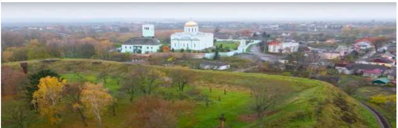
Рис. 2.1. Пам'ятка археології Західного Полісся. Городище «Вали» у м. Володимир-Волинський [44]

Одним із найбільш відомих історичних міст Волинського Полісся, які збереглися до наших часів є м. Володимир-Волинський. Стародавній центр міста, що походить від князівської династії X-XII століть, є найдавнішою пам'яткою міста. Перша історична згадка про нього датується 988 роком, у зв'язку з актом передачі князем Володимиром Великим князівського домену своєму синові Всеволоду. Укріплення Володимирського Дитинця характеризувалися приблизно чотирикутною формою, розмірами 130x240 метрів, і займали велику площу - 3,12 га. Ця споруда уособлювала типову оборонну архітектуру Волині. Місто оточував зовнішній оборонний мур, який зазвичай називають «окольнім городом». Крім того, на лівому березі річки Луг було збудовано оборонну лінію укріплень. Ці вали мали дерев'яні стіни, збудовані у вигляді каркасу або зубчастого муру, хоча випробування часом витримали лише фрагменти зовнішньої стіни [14].