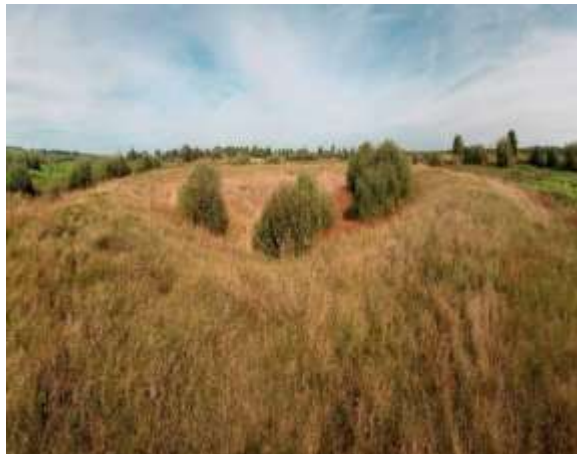
Рис. 2.30. Пам'ятка археології Західного Полісся. Городище у с. Зарічне [71]

Еволюція погостів відображає перехід Русі від язичництва до християнства, коли на зміну храмам прийшли дерев'яні церкви. Слово «погост» набуло нового значення, позначаючи заїжджий двір для мандрівних сановників і торговців. Артефакти Зарічного, що демонструють складні ювелірні вироби з далеких країн, натякають на жваву торгівлю в 9-11 століттях. Історичні документи, в тому числі Словник географічного Королівства Польського, підтверджують існування поселення в 10 столітті [22].