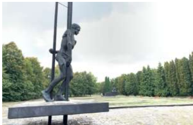
Рис. 2.2. Пам'ятка історії Західного Полісся. Меморіальний комплекс «Жертвам фашизму» у м. Володимир-Волинський [35]

табору «Норд-Офлаг 365» (1941-1944 роки), створеного і керованого нацистськими окупантами. За оцінками, протягом трьох років нацистської окупації понад 25 000 військовополонених зазнали страт, голоду та катувань, причому ця цифра наводиться в різних джерелах. Загалом за колючим дротом постраждали 42 000 в'язнів. Зараз меморіал нагадує жителям міста та туристам про темну сторінку історії Західного Полісся, пов'язану з репресіями гітлерівського режиму [36].