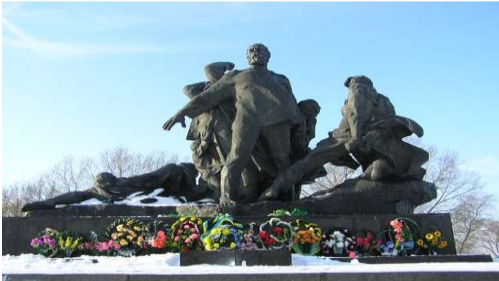
Рис. 2.2. Пам'ятка Західного Полісся. Меморіальний комплекс «Жертвам фашизму» у с. Кортеліси [12]

інформативний музей та сім братських могил, які зберігають пам'ять про тих, хто страждав і загинув.[37]