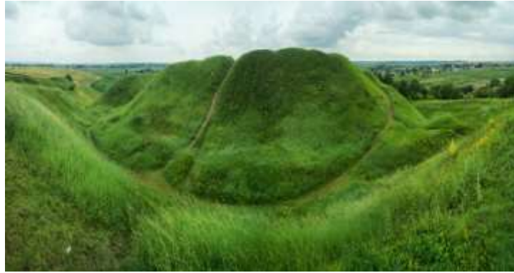
Рис. 2.31. Пам'ятка археології Західного Полісся. Городище у с. Білів [4]

характерного поховання ювеліра: залізні молотки, ковадло, бронзові шаблони для виготовлення ювелірних виробів, різноманітні терези. Однак на межі XI-XII століття Білівське городище занепадає, поступаючись місцем фортеці в Пересопниці - нащадку літописного міста, яка перебрала на себе роль резиденції місцевого князя або представників князівської адміністрації [51].