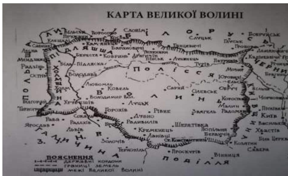
Рис. 1.2. Територія історико-культурного регіону «Велика Волинь» [98]

Поняття «Волинь» історично демонструвало певну стабільність, хоча і з незначними змінами в інтерпретації, окресленні та історичному контексті. Науковці з різних дисциплін, від історії та етнології до топоніміки, геральдики, географії, філології тощо сходяться у думці щодо стійкості характеру цього терміну. Однак його визначення еволюціонувало, якщо дивитися на нього крізь історичну призму. У давнину «Волинь» означала територію, населену різними слов'янськими племенами, такими як дуліби, бужани, лучани та волиняни. Автентичність назв конкретних племен та їхніх територій є предметом наукових дискусій, що ґрунтуються на літописах, спогадах іноземних авторів, археологічних знахідках тощо. Поєднання часових і просторових характеристик підкреслює, що поняття «Волинь», чи то «Волинська земля», «Волинське князівство», «Волинське воєводство», «Волинське намісництво», «Волинська губернія» або більш сучасне «Волинська область», ніколи точно не охоплювало всю Велику Волинь (див. Рис. 1.2.)