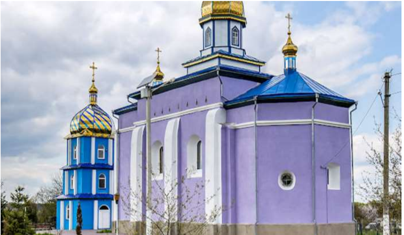
Рис. 2.18. Пам'ятка архітектури Західного Полісся. Церква Пресвятої Трійці у с. Тростянець [41]

У Маневицькому районі Волинської області, в селі Боровичі, стоїть церква Різдва Пресвятої Богородиці - споруда 1937 року, яку приписують архітектурному проекту Сергія Тимошенка. Церква Різдва Пресвятої Богородиці в Боровичах є історичним та культурним скарбом, сповненим відмінних рис. Найбільше привертають увагу його характерні тюльпаноподібні куполи, хоча й дещо спотворені через неідеальну реставрацію, а також функціональні вікна. Ці архітектурні елементи безпомилково відображають руку С. Тимошенка, особливо в дизайні хрестів зі скромними раменами.