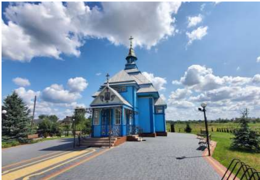
Рис. 2.17. Пам'ятка архітектури Західного Полісся. Церква святого Івана Хрестителя у с. Прилуцьке [50]

своїм самобутнім дизайном, центральним центром якого є простора квадратна нава. Ця велика нава з усіх боків оточена меншими архітектурними елементами, включаючи вівтар з прибудованими ризницями на сході, компактні бічні прибудови на півночі та півдні, скромний бабінець з інтегрованими хорами та не менш пропорційний закритий ганок на заході. Увінчує споруду дзвоноподібний купол, що тягнеться до небес, прикрашений ліхтарем, який спирається на чотирикінцевий ліхтар над чотирисхилим дахом нави. На захід від храму все ще стоїть міцна дзвіниця, що характеризується металевим каркасом, на якому розміщено кілька дзвонів, укритих під пірамідальним дахом [86].