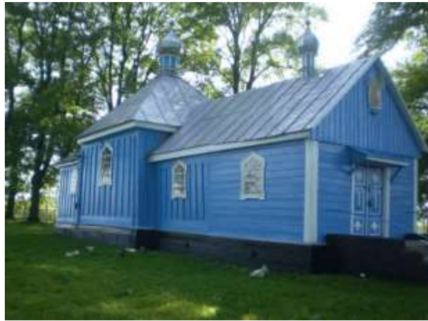
Рис. 2.22. Пам'ятка архітектури Західного Полісся. Церква св. Параскеви у с. Підгірне [79]

Було детально проаналізувавши релігійні споруди Західного Полісся, які розташовані на території Волинської області, автор стверджує, що їх різноманіття є лише додатковим свідченням того, що цей регіон є скарбницею історичних та культурних пам'яток. За результатами дослідження авторкою складено зведену таблицю з хронологічною систематизацією проаналізованих об'єктів культурної спадщини Західного Полісся (див. Таблиця – 2.3) [45].