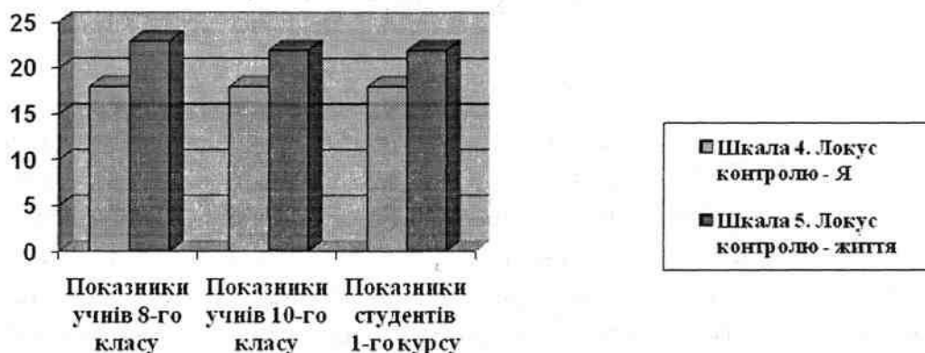
Рис. 2. Середні значення показників шкал «Локус контролю - Я», «Локус контролю - життя»

«Локус контролю - життя» домінує у всіх вікових категоріях досліджуваних (рис. 3), що свідчить про впевненість у собі, у можливості керування власним життям, вільно приймати рішення та втілювати їх у життя. «Локус контролю - Я» знаходиться на середньому рівні розвитку, що вказує на впевненість опитуваних у собі як особистості, яка здатна самостійно побудувати своє життя у відповідності із власними цілями та принципами.