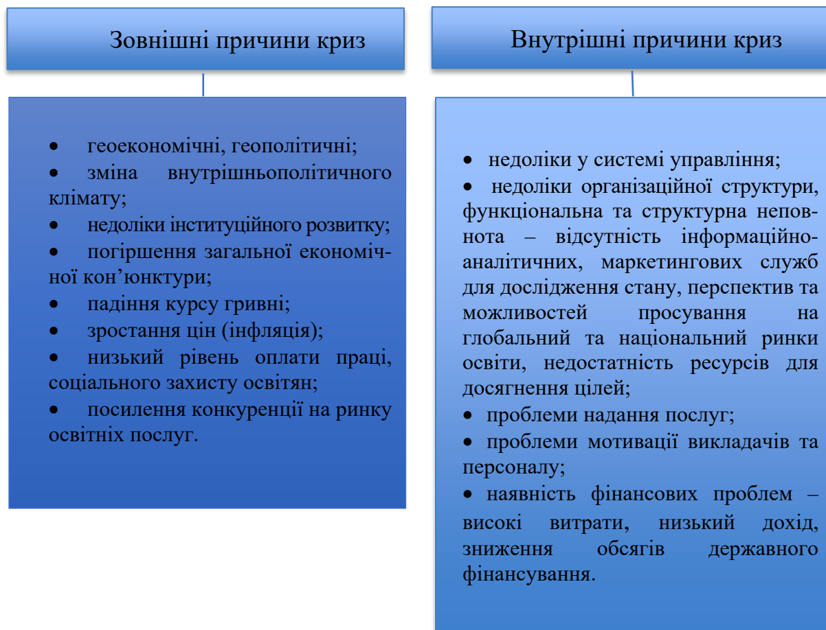
Рис. 1. Зовнішні та внутрішні причини криз закладів вищої освіти [9].

Існують зовнішні та внутрішні причини криз закладів вищої освіти (рис.1):