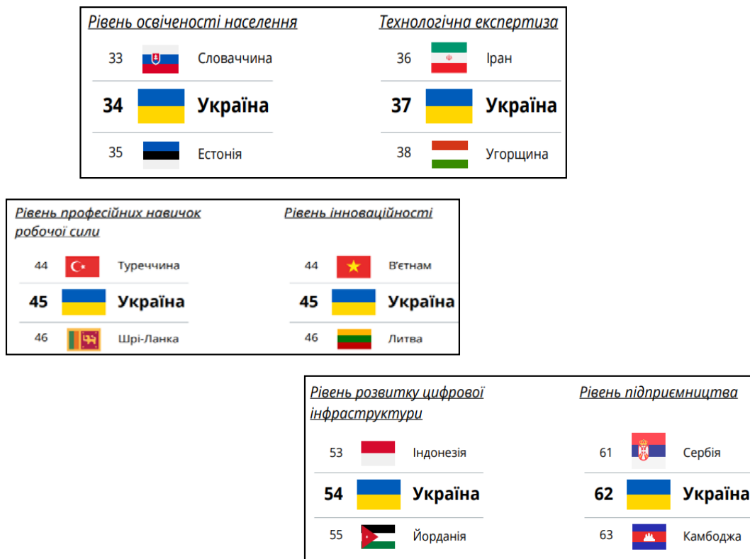
Рисунок 3 – Рівні визнання України щодо технологічного розвитку, 2023 р.

За результатами дослідження StartupBlink [10] світове населення посередньо сприймає Україну з огляду на рівень її технологічного розвитку. Найбільше визнання українці отримують за рівень освіченості та професійних навичок. На думку іноземців, у 2023 році Україна посідає такі наступні місця серед 87 країн світу (рис. 3).