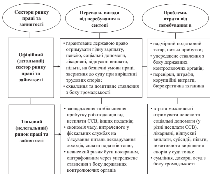
Рис. 2.3. Матриця переваг і втрат від перебування в офіційному та тіньовому секторах ринку праці та зайнятості населення в Україні

ці та зайнятості населення, спонукати їх сплачувати податки, показувати, а не приховувати свої доходи, легально здійснювати економіко-господарську діяльність на основі запровадження відповідної системи стимулів і втрат. Рішення щодо перебування в нелегальному секторі ринку праці та зайнятості населення, що прийматимуться економічними агентами (роботодавцями, працівниками) і державними чиновниками, повинні бути «нераціональними», економічно не вигідними (мінімальними), засуджуватися громадськістю, а покарання в разі викриття правоохоронними органами – невідворотними й такими, що не мають термінів давності. В цьому контексті очікувані втрати та ризики, пов'язані з прийняттям такого рішення вказаними вище суб'єктами, стають максимально можливими.