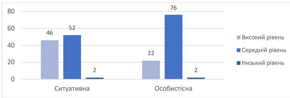
Рис. 3. Показники ситуативної та особистісної тривожності, у %

Значна частина учасників, це 46 %, мають високий рівень ситуативної тривожності, що може вказувати на велику чутливість до конкретних ситуацій. 52 % військовослужбовців мають середній рівень, що може свідчити про відсутність значущого впливу зовнішніх чинників на їхні емоції. І лише 2 % учасників мають низький рівень ситуативної тривожності, що може свідчити про те, наскільки вони стійкі до стресу. У категорії особистісної тривожності 22% учасників мали високий рівень її прояву, що може свідчити про індивідуальні аспекти емоційної реакції. 76%, а це більшість, мають середній рівень особистісної тривожності. Це вказує на стабільність психічного стану в контексті особистісних аспектів. Та один учасник (2 %) має низький рівень особистісної тривоги. Це вказує на відсутність особистісних турбот.