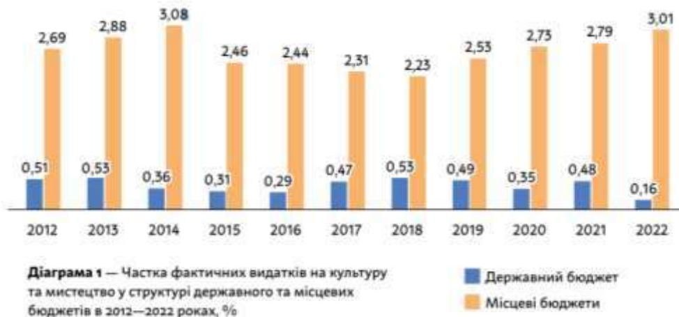
Рис. 1. Частка фактичних видатків на культуру та мистецтво у структурі державного та місцевих бюджетів в 2012-2022 рр., % [15]

Важливо відзначити, що незважаючи на позитивні тенденції в місцевих бюджетах, загальний стан фінансування культури залишається нестабільним. Це створює додаткові виклики для культурних інституцій, змушених адаптуватися до нових умов фінансування та шукати альтернативні джерела доходів. Ситуація з фінансуванням культури в регіонах, які безпосередньо постраждали від військових дій, є особливо складною. Значне скорочення видатків на культуру в цих регіонах відображає загальну економічну та соціальну кризу, спричинену війною. Це вимагає від Уряду та місцевих органів влади розробки спеціальних програм та стратегій для підтримки культурного сектору в умовах кризи. У цьому контексті важливою є розробка комплексного підходу до фінансування культури, який би враховував потреби різних регіонів та забезпечував стабільність та розвиток культурних інституцій. Це може включати залучення приватних інвестицій, розвиток меценатства, а також розробку нових моделей державно-приватного партнерства в культурній сфері. Такий підхід дозволить не лише подолати існуючі виклики, але й забезпечити сталий розвиток культурного сектору.