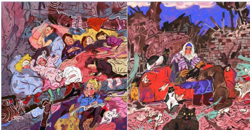
Рис. 2. Ілюстрації Ю. Тверітіної «Діти сплять у підвалі на земляній підлозі», «Бабуся з котами та собакою на руїнах свого будинку».

Наприклад, ілюстрація «Бабуся з котами та собакою на руїнах свого будинку», що підготовлена на основі історії подруги Маші про її 89-річну бабусю, що вийшла з підвалу зі своїми п'ятьма котами та собакою.