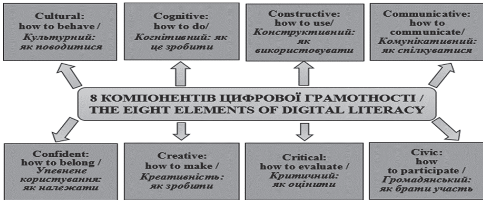
Рис. 1 20

Українські науковці Т. Гаврілова й Я. Топольник представили унаочнення схарактеризованих Д. Белшоу компонентів у вигляді схеми (див. рис.1.).