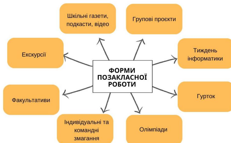
Рис. 2. Форми позакласної роботи з інформатики