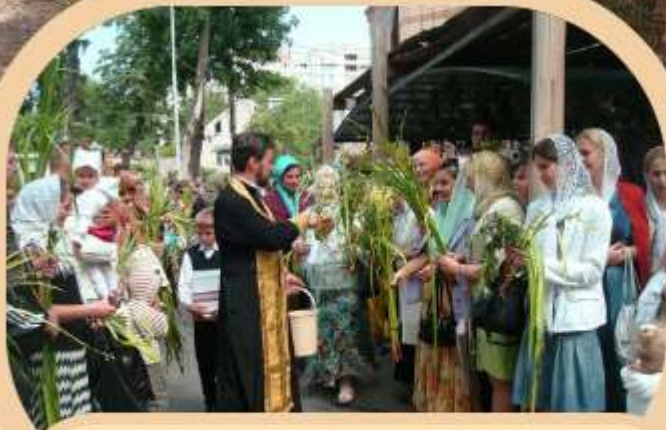
Зелені свята. Вінниця, 2012.