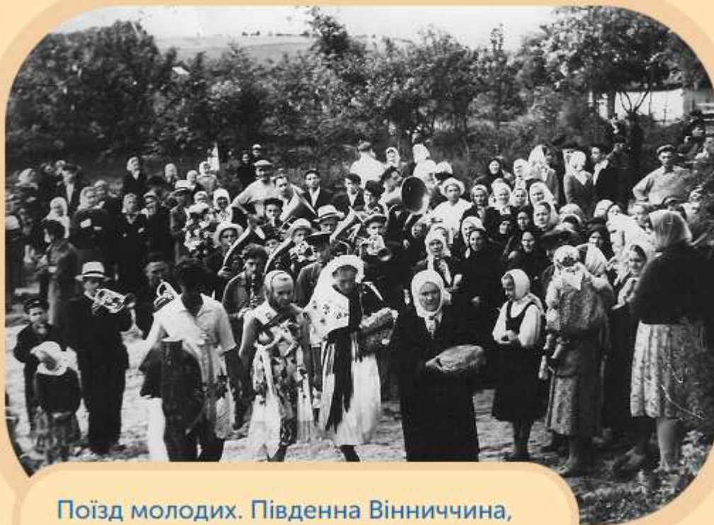
Поїзд молодих. Південна Вінниччина, кінець 1960 рр.