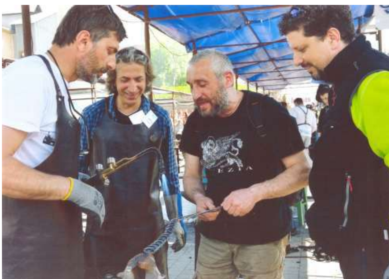
Учасники ковальського фестивалю під час проведення майстер-класу (м. Івано-Франківськ)