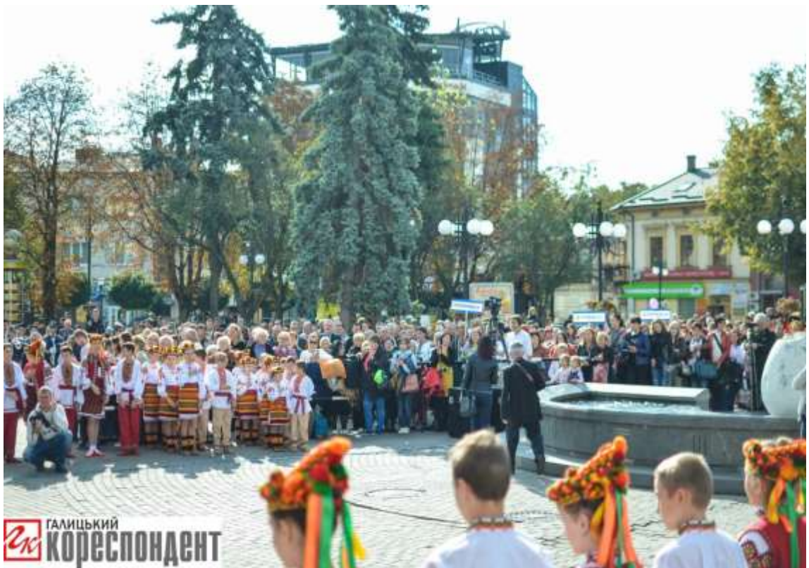
П'ятий Міжнародний фольклорний фестиваль «Родослав»( м. Івано-Франківськ)