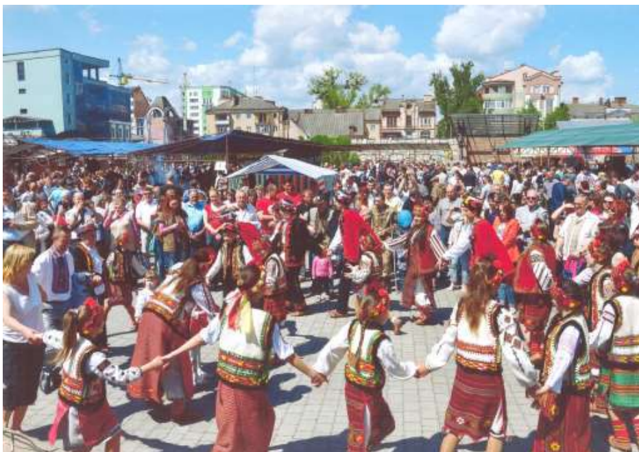
Відкриття міжнародного «Свята ковалів». м. Івано-Франківськ