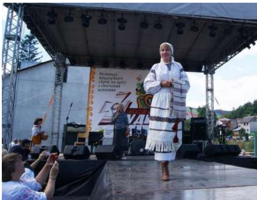
Фестиваль «Черемош-фест», «проект Лудине»