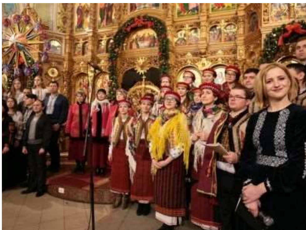
Різдвяний фестиваль «Коляда на Майзлях» (м.Івано-Франківськ).