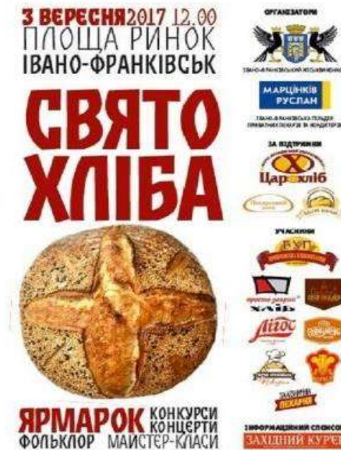
Фестиваль «Свято хліба»(м. Івано-Франківська, площа Ринок)