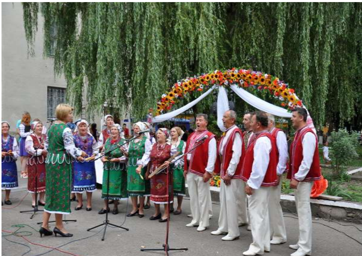
Учасники фольклорно-етнографічного фестивалю «Співочий гай» (м. Калуш)