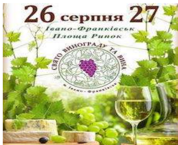
Фестиваль «Свято винограду та вина» (м. Івано-Франківськ, площа Ринок)