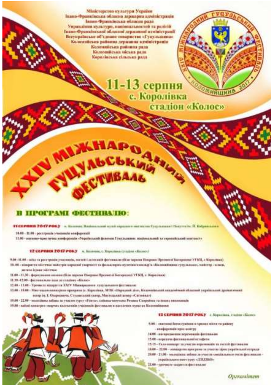
XXIV Міжнародний Гуцульський фестиваль (Коломийщина, с. Королівка)