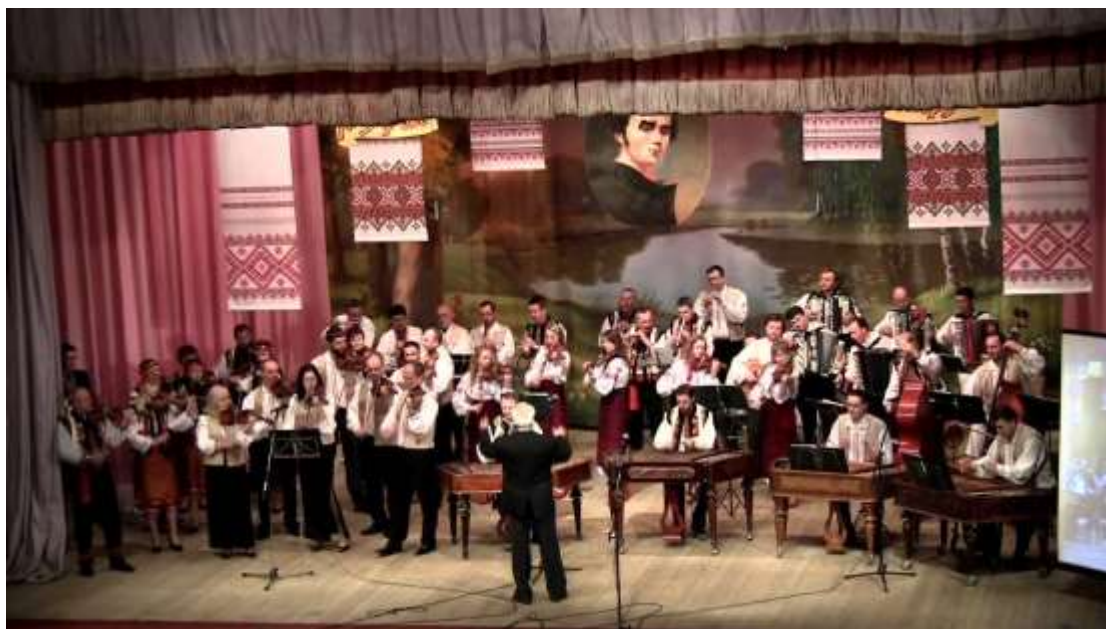
XV обласний фестиваль оркестрів народної музики «Кобзареві струни» (Народний дім Рожнятівщини)