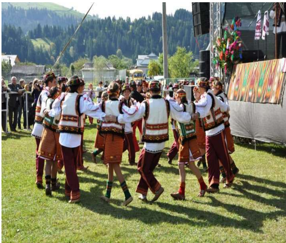
XXII Міжнародний Гуцульський фестиваль