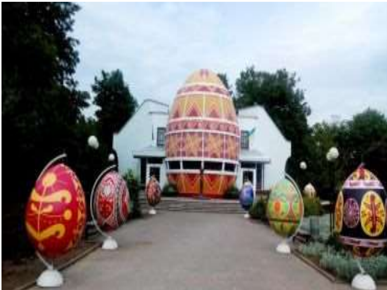
XI Всеукраїнський фольклорний фестиваль «Писанка» (м. Коломия )