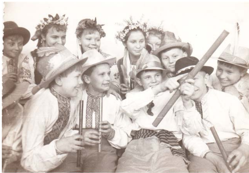
Ансамбль сопілкарів с. Здовбиця Золбунівського р-ну, 1966 р.