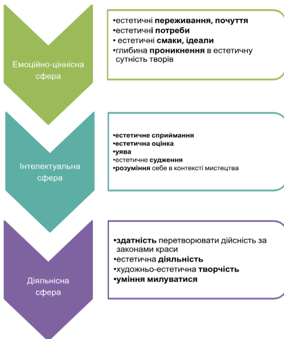
Рис.3. Структура поняття «Естетичне ставлення до дійсності»