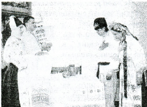
Молоді за столом на покуті. Фото А. Похилока, 2004

руки свекру та свекрусі й після цього подавала їм рушник.