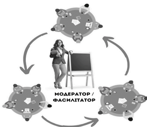
Рис. 2. Схема проведення «Педагогічного кафе»

Умовна схема проведення «Педагогічного кафе» представлено на рис. 2.