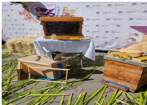
Рис. 2. Цех на пасіці с. Малі Сади Дубенського району Рівненської області

Обсяг доступних заходів і розмір групи залежать від місць прийому та кількості працівників, залучених до проведення занять такого типу. Поширеними є туристичні пам'ятки, знайдені на пасіці, та музеї про-