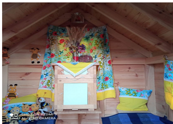
Рис. 4. Апібудиночок з апі-інгаляційною кімнатою з приватної садиби с. Малі Сади Дубенського району Рівненської області

Під час таких занять можна дізнатися про старовинні та сучасні рецепти страв з медом, здобути навички приготування та випічки, а також спекти медовий пряник. На рис. 5 показано вироблену продукцію Малосадівського ліцею продукцію. Продукція виготовлялася під час участі у благодійному майстер-класі з розпису медових пряничків до Свята Покрови. Як і в попередньому випадку, організація такого типу майстерень для великих груп потребує відповідних приміщень, які можуть собі дозволити ліцеї та окремі власники пасік.