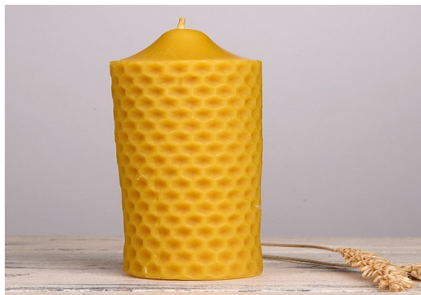
Рис. 3. Воскові свічки з приватної садиби с. Малі Сади Дубенського району Рівненської області

Цікавою ініціативою, яка все частіше застосовується на пасіках та агротуристичних господарствах, є сади медоносів, де кожна рослина чітко описується назвою, періодом цвітіння та корисністю для бджіл (медоносність). Створення такої пропозиції вимагає порівняно невеликих фінансових вкладень і приносить значний ефект, слугуючи навчальним матеріалом, візуальною привабливістю та додатковою користю для бджіл. Ще одним елементом пропозиції апі-туризму, що має величезну кількість розвивального потенціалу, є апітерапія – застосування меду та продуктів бджільництва для лікування різних захворювань. Таке лікування безпосередньо впливає на організм пацієнта, тому проводиться тільки під контролем лікаря. Однак існує низка методів лікування, які не вимагають участі лікаря і можуть позитивно вплинути на здоров'я та красу.