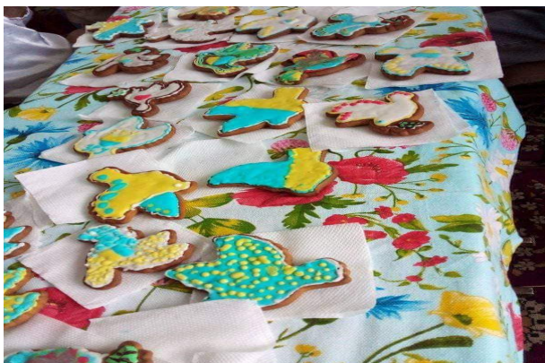
Рис. 5. Медові пряники та інша продукція бджільництва з приватної садиби с. Малі Сади Дубенського району Рівненської області

Щоб перевірити інтерес туристів до пропозиції апітуризму, проведено опитування серед 60 людей, які раніше не брали в ньому участі.