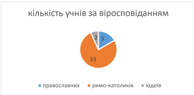
Рис.3. Розподіл учнів чеської Високонської школи на Волині за віросповіданням, 1890 рік, в кількості осіб.

(Список чехов, живущих в селе Мирогоще Дубенского уезда, присоединившихся к Православной Церкви в августе 1871 года, 1871). «Волинські єпархіальні відомості» у 1896 році писали, що «в чеському поселенні Квасилові Дубенського 1 повіту освячено з великою урочистістю ... чеський православний храм, побудований, головним чином, на кошти Святішого Синоду, з причини численних випадків доєднання чехів до православ'я» (К чеському вопросу на Волини, 1896, с.85). З нагоди освячення церкви місцева читальня (російська, зрозуміло) отримала набір книг: читальня, як свідчать історичні матеріали, «не тільки дала церкві старанних співаків, але й старається поширювати в середовищі молодих і старших господарів ґрунтовне знання російської мови, історії і географії їхньої нової Вітчизни, об'єднує членів спільноти братськими стосунками» (Торжество освящения новой церкви в чешском поселке Квасилове и двадцатилетний юбилей основания сего поселка, 1896,с. 80). Зауважимо, що чеська школа у с. Квасилів Дубенського повіту була однією з найбільших за кількістю учнів у Волинській губернії (59 осіб). Інші школи налічували від 8 до 50 учнів (Іваненко, 2016, с. 36). О. Іваненко (2016) подає як приклад конфесійний склад чеської Високонської школи, який ми інтерпретували на рис.3.