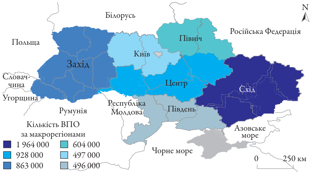
Іл. 2. Матриця відстеження переміщень громадян України

грудня 2022 р. [41]. Ці дані слугують важливим джерелом для визначення територій із високими гуманітарними потребами та для цільового реагування, що спрямоване на допомогу постраждалим від війни, а також для ухвалення управлінських рішень і вироблення державної політики.