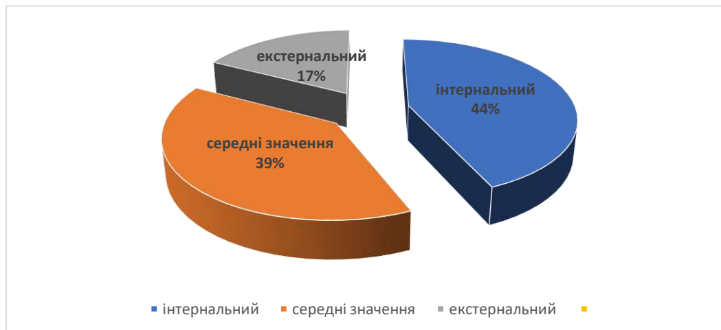
Рис.2. Співвідношення показників загальної інтернальності-екстернальності (за шкалою загальної інтернальності методики РСК)

контролю схильні проявляти невпевненість у своїх здібностях, тривожність, неврівноваженість, підозрілість, конформність і агресивність, прагнення відкласти реалізацію своїх намірів на невизначений термін.