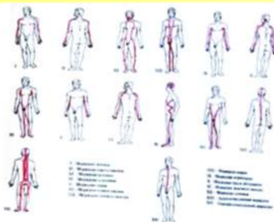
Рис. 1 Основні меридіани

Також майбутні фахівці фізичної терапії навчитися використовувати масажну ручку меридіан DF-618, дерев'яні шкребки, власні фаланги пальців для знаходження та натискання на біологічно активні точки обличчя, кисті рук та інші окремі ділянки тіла людини згідно 12-ти меридіан (рис. 2-3, табл. 1).