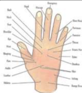
Рис. 3. Акупунктура (біологічно активні ділянки/ точки) на тильній частині кисті (верхня кінцівка)

Після розгляду ситуаційних задач на практичних заняттях, здобувачі вищої освіти описували результат проведених маніпуляцій через власний практичний досвід. Було розглянуто позиції притискання біологічно активних точок при безсонні.