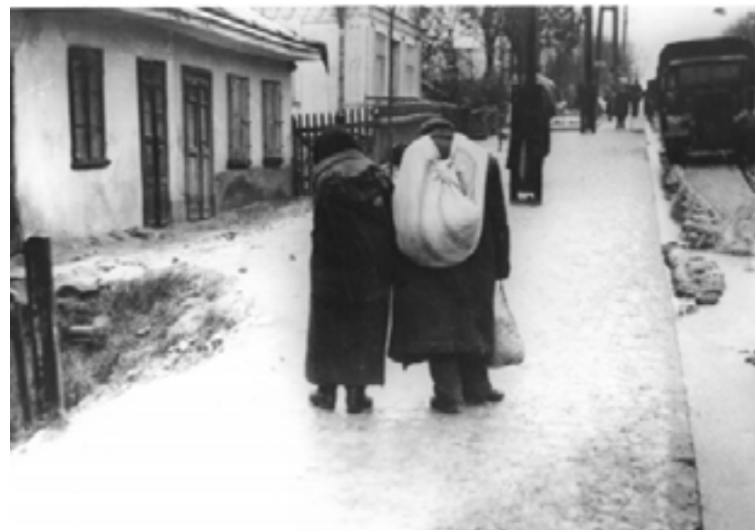
Фото 3, 4. Євреї Рівного зі своїм майном вирушають в Сосонки, 6 листопада 1941 р.