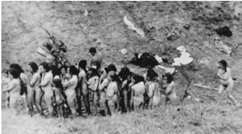
Фото 7. Роздягнуті перед стратою єврейські жінки та діти в Мізочі, 14 жовтня 1942 р.