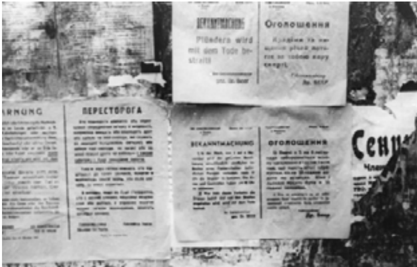
Фото 12. Оголошення гебітскомісара Рівного д-ра Беєра про застосування смертної кари за крадіжку майна

У справі привласнення майна жертв Голокосту виникала конкуренція між владними структурами та місцевими неєврейськими жителями. Маючи виключне право на заволодіння таким майном, окупаційні органи застосовували покарання конкурентів, включно до розстрілу. У відповідних наказах закріплювалося монопольне право на майно євреїв місцевої влади. Загальноприйнятою практикою було передавати затриманих грабіжників поліції з нагробованими речами 113 . Укази щодо покарань відрізнялися різними мірами жорсткості – від превентивної перестороги «цивільним особам реквізувати доми, знаряддя, нагрівальні елементи, домашні тварини» 114 , до покарання смертю за присвоєння «жидівського» майна, що розцінювалося, як грабіж 115 . Для прикладу, в одному з таких оголошень у листопаді 1941 р. за підписом гебітско-місара Рівного – д-ра Беєра вказувалося, що «крадіжки та нищення речей потягає за собою кару смерті» (Фото 12) 116 .