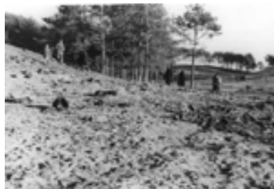
Фото 8–11. Пошук місцевими жителями речей, цінностей на місці розстрілу рівненських євреїв у «Сосонках» у листопаді 1941 р.

цінності 104 . Зокрема, на світлинах видно людей та жінку, яка приміряє взуття, знайдене на місці страти (Фото 8–11) 105 .