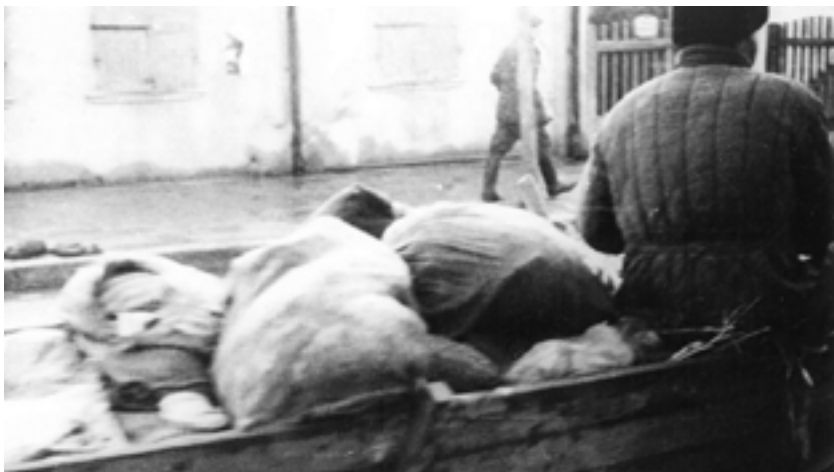
Фото 5. Перевезення майна розстріляних євреїв до пункту зберігання

Зібрані з місць страти речі доставляли в пункти зберігання та продажу. У Рівному такі речі, за свідченнями єврейки Варвари Барац, звозили в синагогу 97 . У Бундесархіві збереглися світлини такого перевезення (Фото 5) 98 .