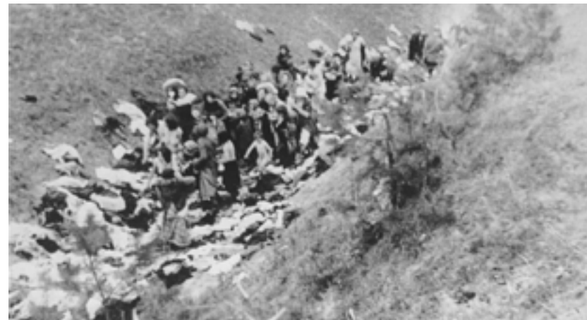
Фото 6. Роздягнуті перед стратою єврейські жінки та діти в Мізочі, 14 жовтня 1942 р.

масового вбивства євреїв, дали одяг, бо в його сім'ї було багато (десять) дітей 100 . В окремих випадках працівникам «small death jobs» вдалося не лише отримати єврейські речі, а й дати можливість скористатися такою нагодою іншим жителям. Наприклад, у Четвертні, за спогадами свідка, чоловіки, що закопували ями, переказували іншим людям, що вони можуть брати собі єврейські речі 101 . Така можливість також була надана жителям Мізоча – одяг, що лежав у рівчаку, зі слів свідка, давали вибирати людям 102 . Серед світлин екстермінації мізоцьких євреїв існують дві, на яких видно хаотично розкиданий одяг поряд із жертвами (Фото 6, 7) 103 .