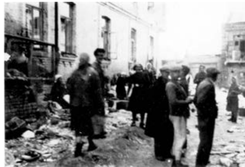
Фото 1. Місцеві мешканці Луцька грабують гетто після його ліквідації 3 вересня 1942 р.

мешканці Луцька грабують гетто після його ліквідації 3 вересня 1942 р.» 73 (Фото 1).