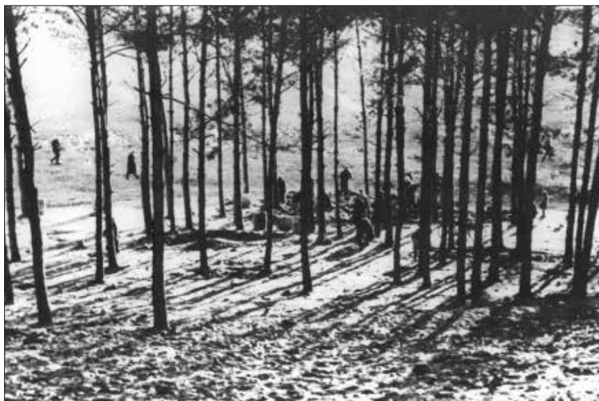
Рис. 2, 3, 4. Світлини співробітника штабу командувача Вермахту в Україні, журналіста Ганса Пільца, зроблені після розстрілу євреїв у Сосонках (листопад 1941 р.). «Після розстрілів я з моїм другом Штраусом 16 листопада був на місці страти і в прекрасну сонячну погоду фотографував українців, які в пошуках цінностей рили землю» (Varch В 162/2876, ВІ. 69).