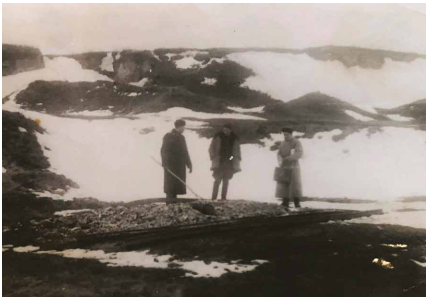
Рис. 10. Виявлення трупів у с. Видумка, де нацисти розстрілювали та спалювали цивільних жителів.

у с. Видумка біля піщаних кар'єрів, свідчила, що вона неодноразово бачила розстріли та спалення радянських громадян від літа 1943 р. до січня 1944 р. За її словами, у червні 1943 р. на чотирьох машинах привезли і розстріляли близько 30–40 осіб у самому лише спідньому одязі. У липні 1943 р. розстріляли 300 осіб і спалили їхні тіла. Найбільший розстріл відбувся у вересні 1943 р., коли десять машин привезли 500 осіб, яких так само розстріляли і спалили. Ганна Морозовська згадувала про розстріли інтелігенції 15 жовтня 1943 р. і про останній розстріл 100 осіб, що відбувся 9 січня 1944 р. На її думку, в кар'єрах Видумки було розстріляно та спалено близько 2 тисяч людей 104 .