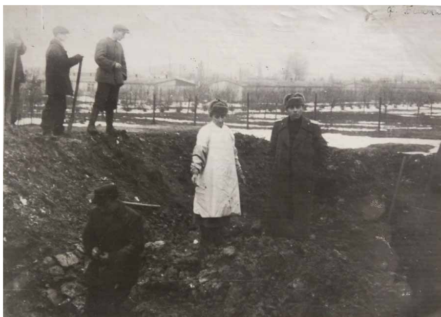
Рис. 11. Розкопки могил на вул. Білій. 1944 р.