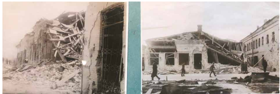
Рис. 1. Наслідки бомбардувань Рівного німецькими окупантами 1944 р. Джерело: Фонд Рівненського обласного краєзнавчого музею. Доп. фонд № 10874 (Фотоальбом)