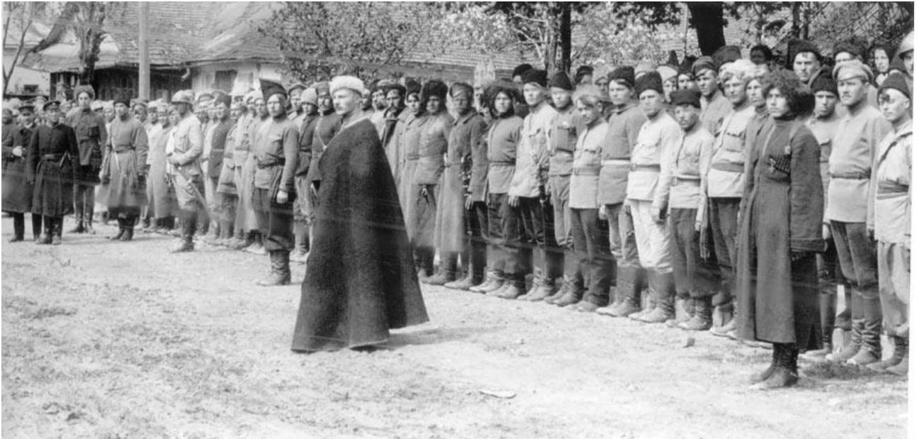
Вояки Запорізької Січі Травень 1919.

[ https://www.google.com/url?sa=i&url=https%3A%2F%2Freibert.info%2Fthreads%2Fzaporozka-sich-juxima-bozhko.171015%2F&psig=AOvVaw2N6DzPL-DxLKv_whzyV-so&ust=1736794301838000&source=images&cd=vfe&opi=89978449&ved=0CBcQjhqxqFwoTCLD3gIzt8IoDFQAAAAdAAAAABAI ]