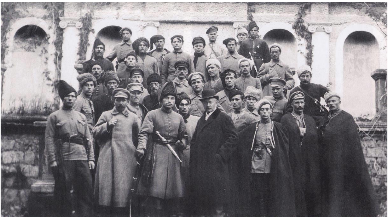
Командний склад дивізії Запорізька Січ

[ https://www.google.com/url?sa=i&url=https%3A%2F%2Ffreibert.info%2Fthreads%2Fzaporozka-sich-juxima-bozhko.171015%2F&psig=AOvVaw2N6DzPL-DxLKv_whzyV-so&ust=1736794301838000&source=images&cd=vfe&opi=89978449&ved=0CBcQjhxqFwoTCLD3gIzt8IoDFQAAAAdAAAAABAI ].