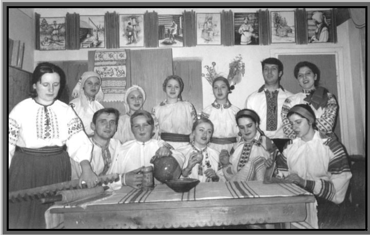
У фольклорній світлиці, 2000 р.