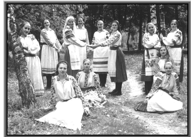
У міському парку ім. Т.Г.Шевченка, 2003 р.