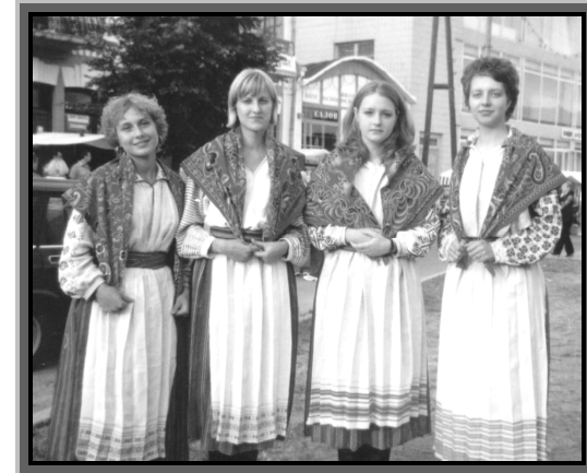
На рок-фестивалі “Тарас Бульба” (Дубно), 2002 р.