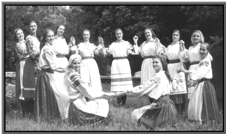
“Потанцюймо гусачка”, 2003 р.