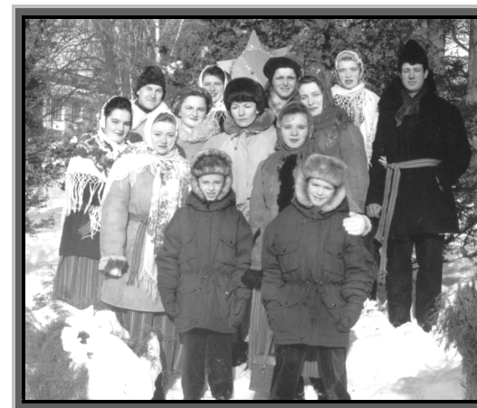
На фестивалі “Коляда” (Рівне), 1996 р.