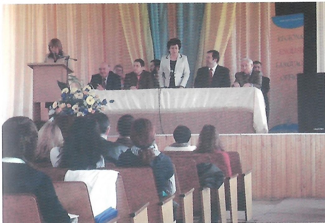
Відкриття XV Міжнародної конференції Всеукраїнської асоціації вчителів англійської мови як іноземної (TESOL Ukraine) «Вивчення англійської мови в контексті безперервної освіти», 2010 рік

EngAdv, English, Germanstud, G-Tutor 1.0, Advanced, Adv 1-2, EchesDoucht, EngPlat, Financial, English gold). Навчальний комплекс дисципліни «Практика усного та писемного мовлення» забезпечений 18-ма аудіокасетами.