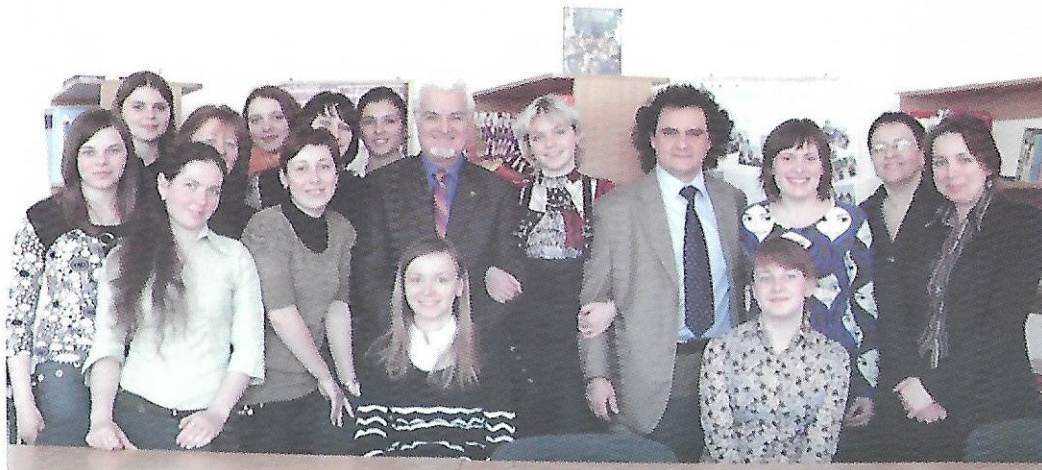
Зустріч спеціального Радника Ради Європи з питань мовної політики Жана-Клода Беако та аташе з питань вивчення та викладання французької мови Відділу культури та співпраці Посольства Франції в Україні Сержа Беліні з викладачами та студентами факультету іноземної філології, 2008 рік