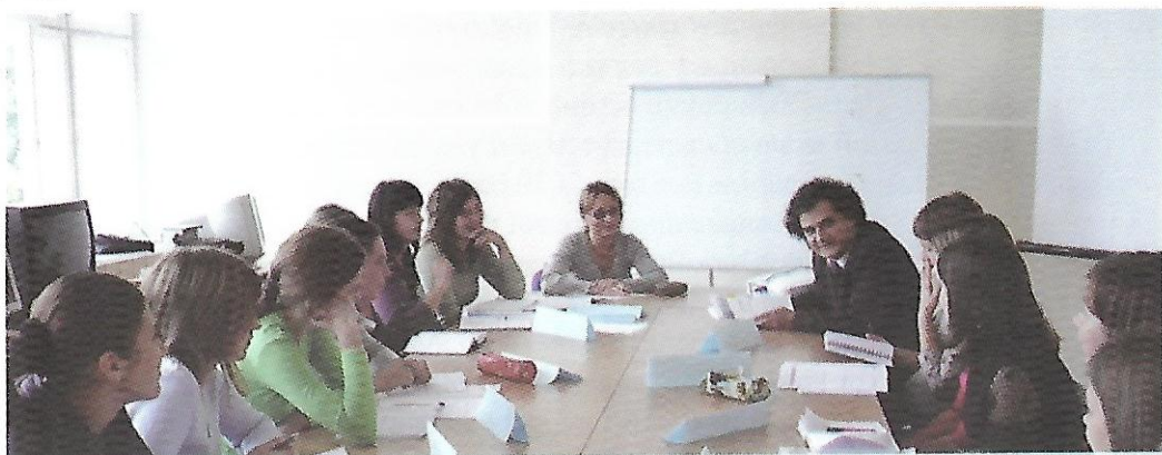
Викладання авторського спецкурсу для студентів факультету професором Сорбони Мар'єлою Каузою, 2007 рік

Вищезазначений досвід був представлений та позитивно сприйнятий на Всеукраїнському семінарі викладачів французької мови двадцяти шести національних та державних університетів України «Оновлення змісту викладання / навчання французької мови в університеті України», що відбувся на факультеті іноземної філології РДГУ у жовтні 2007 року.