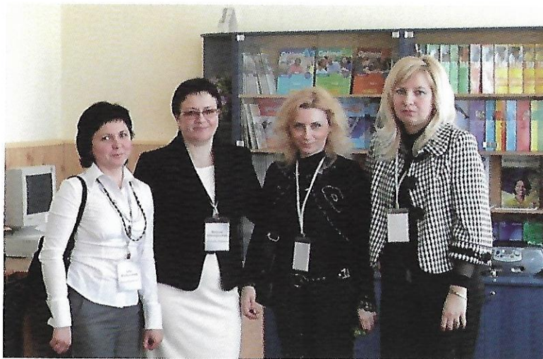
З викладачами німецької мови в день відкриття Центру навчально-методичної літератури Гете-інституту, 2009 рік

Гете-інституту кафедрою регулярно організуються семінари для викладачів німецької мови загальноосвітніх шкіл Рівненської області.