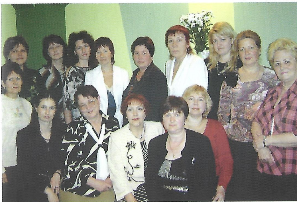
Колектив кафедри теорії літератури і славістики, 2006 рік