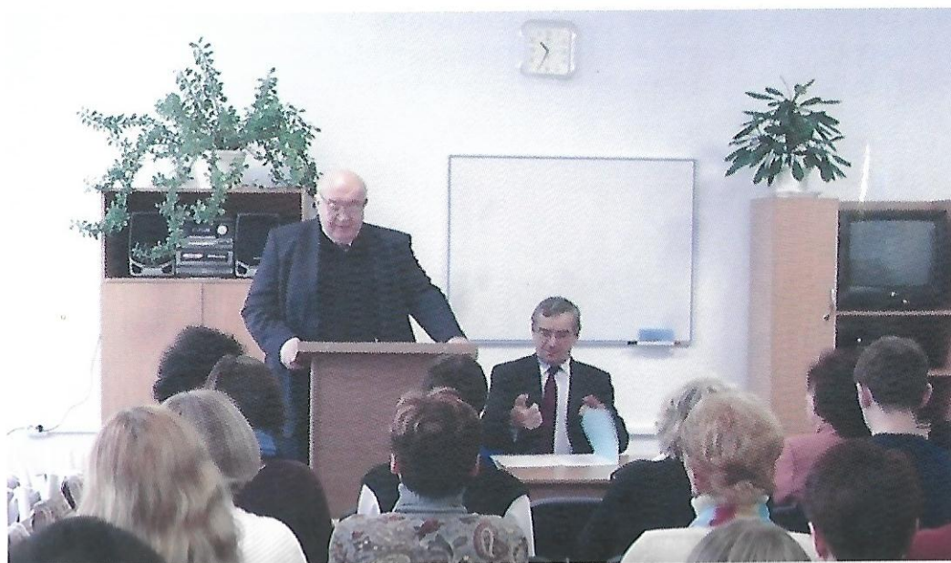
Відкриття «Навчально-дослідницького центру факультету іноземної філології. Відділення французької мови», 2007 рік