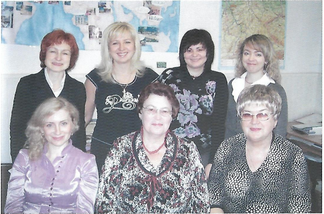
Колектив кафедри романо-германської філології, 2008 рік

нологічних одиниць у германських і романських мовах; комунікативна лінгвістика і теорія мовленнєвих актів; актуальні проблеми теорії та методики викладання іноземних мов у ВНЗ; специфіка номінації у сфері англійської та французької термінології різних галузей знання.