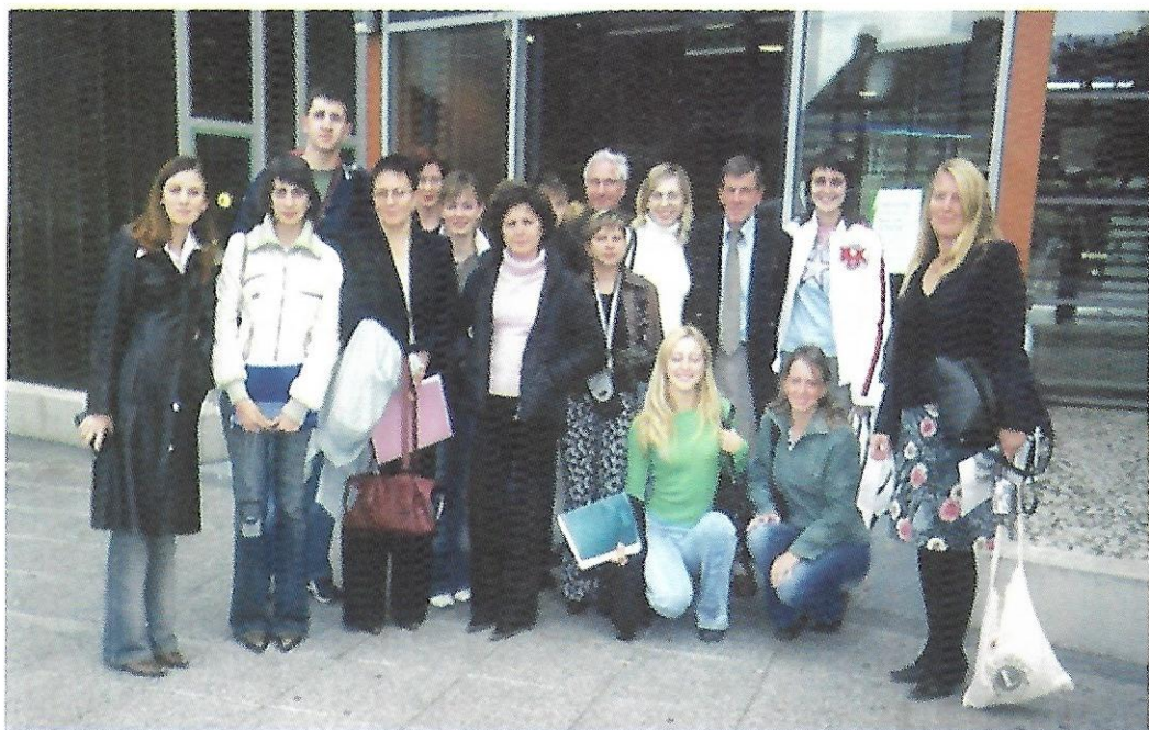
Активні учасники співпраці українсько-німецьких проектів з Euregio-Kolleg м. Вюрзелен, Німеччина, 2004 рік