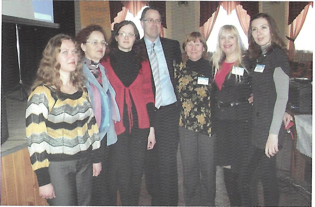
XV Міжнародна конференція Всеукраїнської асоціації вчителів англійської мови, 2010 рік