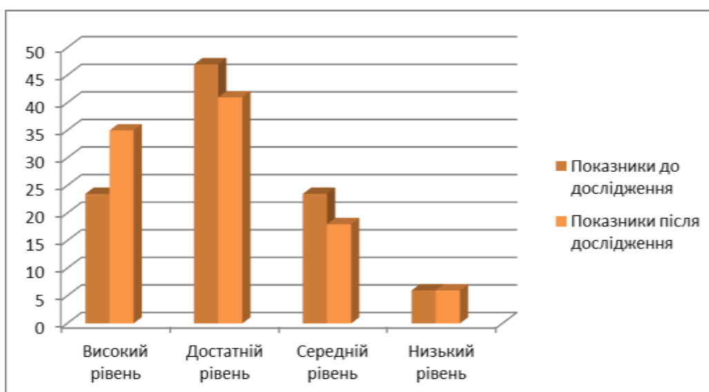
Рис. 2.3. Порівняння показників до і після дослідження

З результатів дослідження експериментального класу видно, що переважна кількість старшокласників мають високий і достатній показники результату