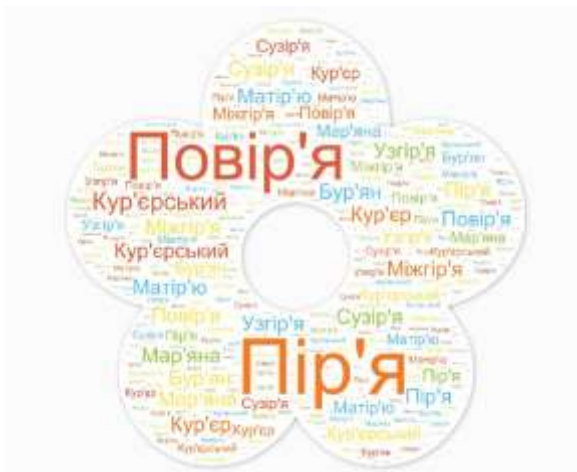
Рис. 6. Приклад хмари слів щодо правил вживання апострофа після твердого р

Для створення хмари слів можна використовувати такі програми: