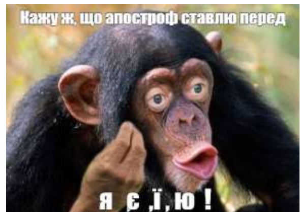
Рис. 4. Зразок мемів про апостроф.

Мотиватор. «Словник української мови online» подає таке визначення мотиватора – «той, хто мотивує до чого-небудь» [37, с. 1678].