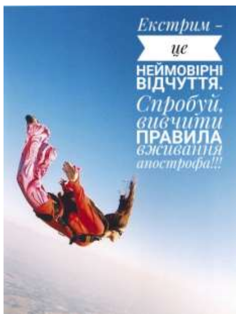
Рис. 5. Зразки мотиваторів для вивчення правил вживання апострофа