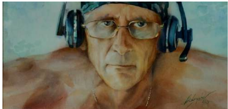
«Автопортрет» акварель, 60x40 см, 2015, Олександр Бобришев